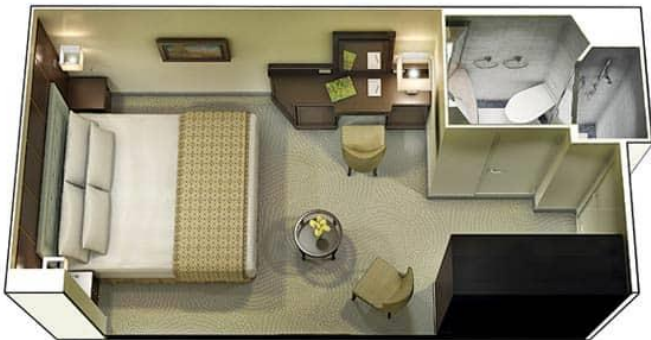
Inside Stateroom : Square Feet 174 | Square Meters 16