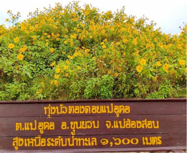
ทุ่งบัวตองดอยแม่ฮอด ต.แม่ฮอด อ.ขุนยวม จ.แม่ฮ่องสอน สูงเหนือระดับน้ำทะเล ๑,๖๐๐ เมตร