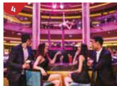
4 Bar 360 Catch live music and aerial acrobatic performances with a glass of champagne.