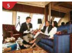
5 The Palace Indulge in European-style butler service and exclusive facilities.