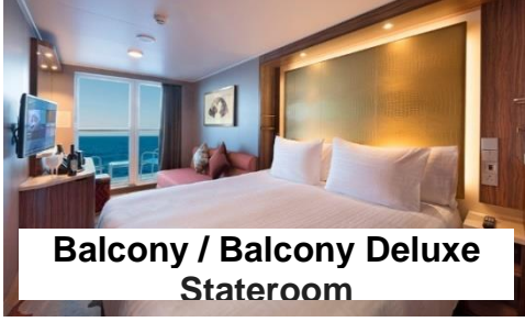
Balcony / Balcony Deluxe Stateroom