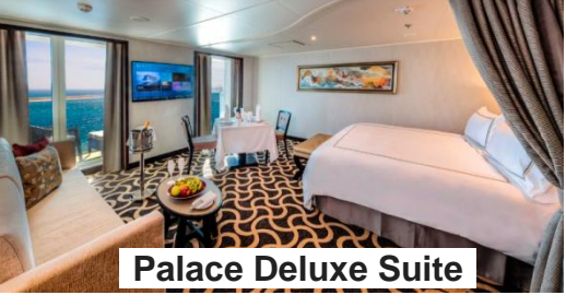
Palace Deluxe Suite