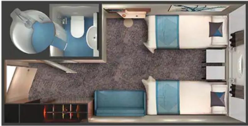
ห้องมีหน้าต่าง Ocean View