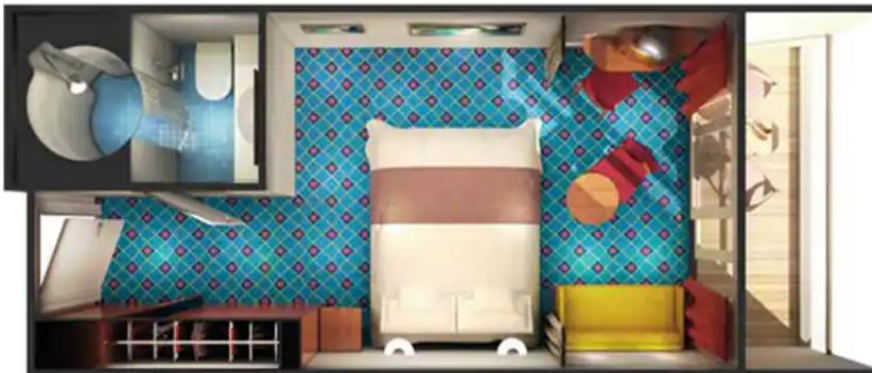
ห้องมีระเบียง Balcony