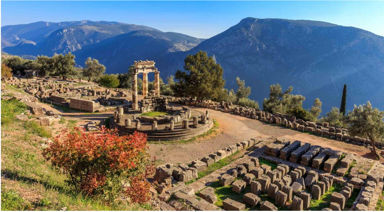
👉 นำท่านสู่ที่พักโรงแรมระดับ 4 ดาวมาตรฐานท้องถิ่น เมืองเดลฟี (2)