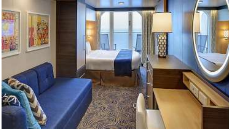
ห้องพักมีระเบียง Balcony

เพื่อประโยชน์ของผู้เดินทาง โปรดศึกษาเงื่อนไขการจองตั๋ว และการยกเลิกตั๋ว ที่ระบุในรายการทั้งหมด หลังจากท่านทำการจองตั๋วแล้ว ทางบริษัทจะถือว่าท่านเข้าใจ และพร้อมปฏิบัติตามเงื่อนไขดังกล่าว