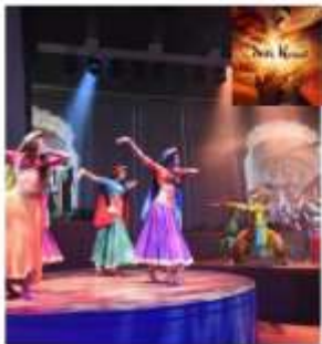
THE SILK ROAD

Touching on the cultures, colors, music, and dance styles of China, Persia, India and Rome, the entertainment extravaganza that is The Silk Road™, will deliver a unique and completely original experience to our guests.