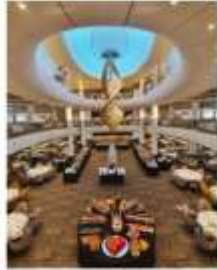
MAIN DINING ROOM