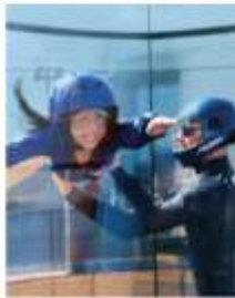
RIPCORD BY IFLY