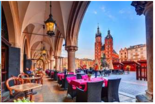
(St. Mary Church) โบสถ์ชื่อดังของครากูฟ สร้างขึ้นในคริสต์ศตวรรษที่ 14 ในสถาปัตยกรรมแบบโกธิค ภายใน