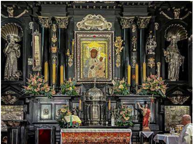
อัศจรรย์ จนกลายเป็นปาฏิหาริย์ที่ศักดิ์สิทธิ์ที่สุด

เที่ยง บริการอาหารมื้อกลางวัน ณ ภัตตาคาร