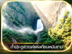
ถ้ำประตูสวรรค์แห่งเทียนเหมินซาน