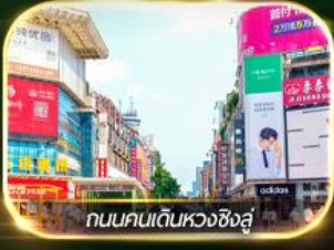
ถนนคนเดินหวงซิงอู๋

หมู่บ้านโบราณฟุรงเจิน + พิพิธภัณฑ์ภาพวาดหินกรวด ตึกมหัศจรรย์ 72 เทียนเหมินซาน ถ้ำประตูสวรรค์ ถนนคนเดินหวงซิงอู๋