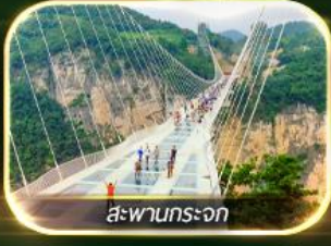
สะพานกระจก