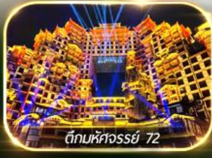
ตึกมหัศจรรย์ 72