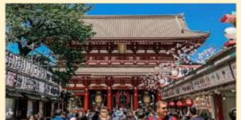
วัดอาซากุสะ SENSOJI TEMPEL | ASAKUSA TOKYO