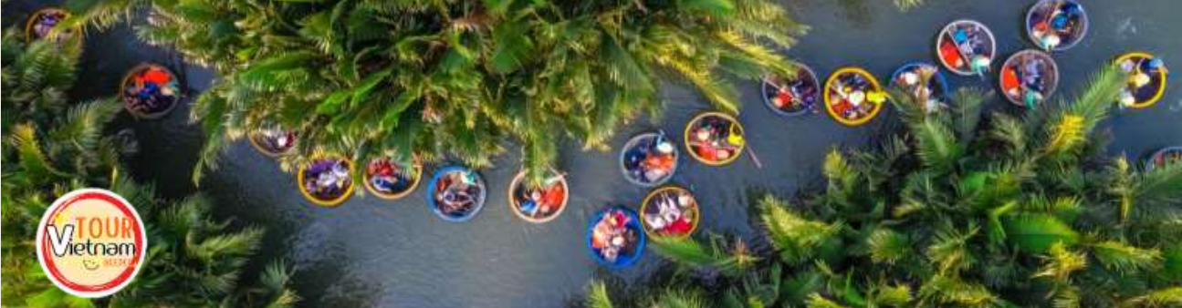
หน้า 8 (ภาพใช้เพื่อการโฆษณาเท่านั้น)

จากนั้นเดินทางต่อไปยัง หมู่บ้านแกะสลักหินอ่อน ซึ่งเป็นหมู่บ้านที่เก่าแก่และยึดถืออาชีพการแกะสลักหินอ่อนมาช้านาน เป็นร้านของฝากท้องถิ่นที่มีสินค้ามากมาย จากนั้นแวะ ช้อปปิ้งร้านกาแฟ เลือกซื้อของฝาก