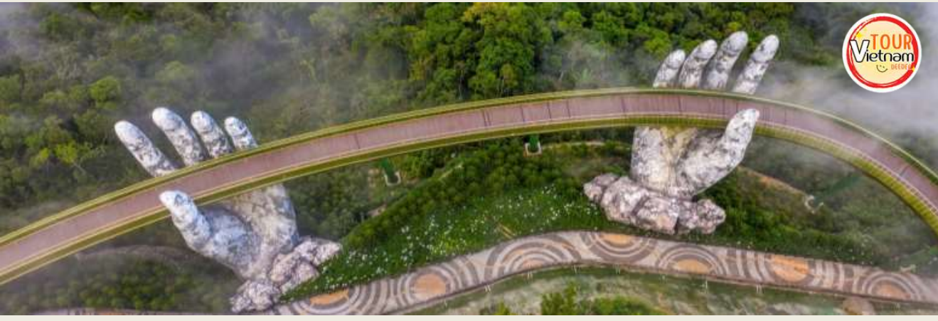
หน้า 5 (ภาพใช้เพื่อการโฆษณาเท่านั้น)

จากนั้นนำท่านชมวิวแห่งใหม่ สะพานมือ (Golden Bridge หรือ สะพานทอง) สิ่งที่น่าสนใจของสะพานนี้คือมีมือยักษ์ ข้างตั้งหงายขึ้นไปบนฟ้าเพื่อรองรับสะพานที่ลอยอยู่บนท้องฟ้า มือยักษ์มีสีเทา-ขาวสวยงามที่ปกคลุมไปด้วยตะไคร่น้ำ ถูกแกะสลักจากหินอย่างประณีต ทำให้หลายคนเรียกสะพานทองว่า “สะพานมือ” ซึ่งสะพานสีทองแห่งนี้ยาว 150 เมตร เหมาะแก่การพักผ่อนหย่อนใจ สูดอากาศอันสดชื่นและชมวิวทิวทัศน์อันกว้างใหญ่ของเมืองดานังที่อยู่เบื้องล่างอีกด้วย