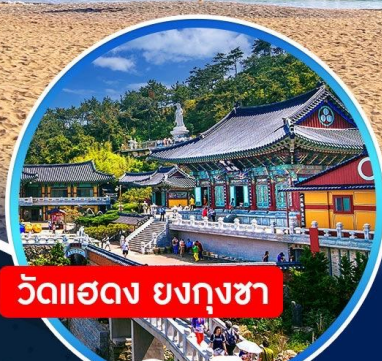
วัดแฮดง ยงกุงซา