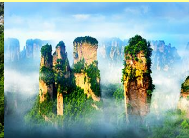
ภูเขาอวตาร

โปรแกรมเสริมที่ 2 โปรแกรมเที่ยวชมอุทยานภูเขาอวตารแบบครึ่งวันที่รวมค่าขึ้นลิฟท์แก้ว (ผู้เข้าร่วมขั้นต่ำ 15 ท่าน) ใช้เวลาประมาณ 4-6 ชั่วโมง (ขึ้นอยู่กับจำนวนนักท่องเที่ยวในแต่ละวัน) อัตราค่าบริการท่านละ 750 หยวนหรือ 3,750 บาท นำท่านเที่ยวชมจุดชมวิวลำธารจินเปียนซีที่สามารถมองเห็นวิวยอดเขาอวตารได้ชัดเจน นำท่านเที่ยวชมจุดชมวิวจินเปียนซีที่สามารถมองเห็นทัศนียภาพของภูเขาอวตารและลิฟท์แก้วได้ชัดเจน นำท่านขึ้นลิฟท์แก้วขึ้นสู่ยอดเขาอวตาร นำท่านเดินชมจุดชมวิวลำธารจินเปียนซีและภูเขาอวตารได้แก่ภูเขาเสาเสวยราชย์ สะพานหนึ่งในใต้หล้า... อัตราค่าบริการรวม ค่าบัตรเข้าอุทยาน ค่ารถรับส่งภายในเขตอุทยาน ค่าน้ำดื่มของไกด์ท้องถิ่น