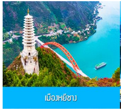
เมืองหยี่ชาง