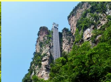
ลิฟท์แก้วไปหลวม