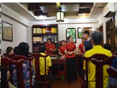
ร้านใบชา