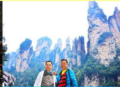
ชมจุดชมวิวลีฟท์แก้ว

โปรแกรมเสริมที่ 1 โปรแกรมเที่ยวชมอุทยานภูเขาอวตารแบบสั้นที่ไม่ขึ้นลิฟท์แก้ว (ผู้เข้าร่วมขั้นต่ำ 15 ท่าน) ใช้เวลาประมาณ 2-3 ชั่วโมง อัตราค่าบริการท่านละ 400 หยวนหรือ 2,000 บาท นำท่านเที่ยวชมจุดชมวิวลำธารจินเปียนซีที่สามารถมองเห็นวิวยอดเขาอวตารได้ชัดเจน นำท่านเที่ยวชมจุดชมวิวจินเปียนซีที่สามารถมองเห็นทัศนียภาพของภูเขาอวตารและลิฟท์แก้วได้ชัดเจน (ไม่ได้รวมค่าขึ้นลิฟท์แก้ว) อัตราค่าบริการรวม ค่าบัตรเข้าอุทยาน ค่ารถรับส่งภายในเขตอุทยาน ค่าน้ำดื่มของไกด์ท้องถิ่น