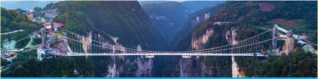
สะพานกระจกข้ามหุบเขาแกรนด์แคนยอน

โปรแกรมเสริมที่ 3 โปรแกรมเที่ยวชมสะพานกระจกพร้อมหุบเขาแกรนด์แคนยอนจากเจียเจี้ย (ผู้เข้าร่วมขั้นต่ำ 15 ท่าน) ใช้เวลาประมาณ 2-3 ชั่วโมง (ขึ้นอยู่กับจำนวนนักท่องเที่ยวในแต่ละวัน) อัตราค่าบริการท่านละ 400 หยวนหรือ 2,000 บาท นำท่านเที่ยวชมสะพานกระจกที่สร้างล้อมหุบเขาที่ยาวที่สุดในโลก ทำทลายความกล้าของท่านด้วยการเดินบนพื้นกระจกใสที่สามารถมองเห็นก้อนเหวลึกที่อยู่เบื้องล่าง....อัตราค่าบริการรวม ค่าบัตรเข้าอุทยาน ค่ารถรับส่งภายในเขตอุทยาน ค่าน้ำเที่ยวของไกด์ท้องถิ่น