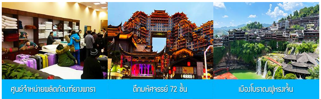
ศูนย์จำหน่ายผลิตภัณฑ์ยางพารา