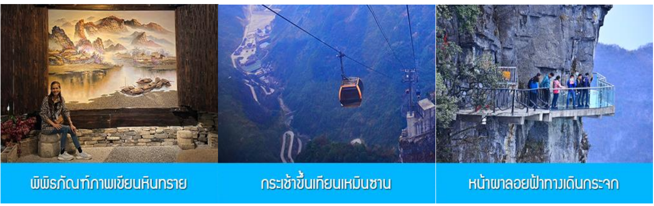
พิพิธภัณฑ์ภาพเขียนหินทราย

พักที่ ZHENMIAN HOTEL OR YINXIANG HOTEL ระดับ 4 ดาวท้องถิ่นหรือเทียบเท่าในเมืองจางเจี๋ย