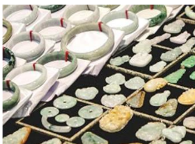
ศูนย์จำหน่ายผลิตภัณฑ์หยก

หลังอาหารนำท่านเดินทางเข้าที่พัก หรือท่านสามารถเลือกซื้อโปรแกรมเสริม เป็นบัตรชมการแสดง ชุด The Love Story of a Wooden man and Fairy fox หรือที่เรียกกันในหมู่นักท่องเที่ยวไทยว่า โชว์จิ้งจอกขาว เป็น การแสดงกลางแจ้งที่ทุ่มทุนสร้างอย่างสุดอลังการ เป็นการแสดงที่น่าดูชมที่สุดในเมืองจางเจียเจีย การแสดงชุดนี้ ใช้ภูเขาประติมากรรมเป็นฉากหลังประกอบการแสดง ซึ่งให้ความรู้ลึกซึ้งจริงเสมือนผู้ชมและนักแสดงอยู่ ท่ามกลางธรรมชาติ ใช้ทีมงานนักแสดงหลายร้อยคน พร้อมระบบแสง สี เสียงที่ทันสมัยประกอบการแสดง อัตราค่าบริการสำหรับโปรแกรมเสริมการแสดงชุด The love Story of Wooden man and Fairy Fox ท่านละ 400 หยวน (หรือ 2,000 บาทขึ้นอยู่กับอัตราแลกเปลี่ยน) ระยะเวลาที่ใช้ในการเที่ยวชมการแสดง ประมาณ 3 ชั่วโมง รวมเวลาเดินทางไป กลับค่าบริการรวม ค่าบัตรเข้าชม ค่ารถรับ ส่ง และค่าน้ำทิพย์ของโถงถ้ำ พักที่ ZHENMIAN HOTEL โรงแรมระดับ 4 ดาวหรือเทียบเท่า