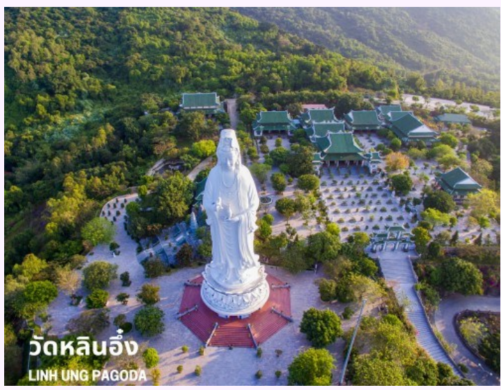
วัดหลินอึ้ง LINH UNG PAGODA

เช้า รับประทานอาหารเช้า ณ ห้องอาหารของโรงแรม