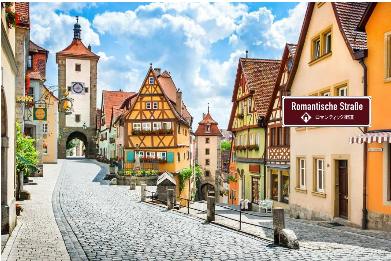
Romantische Straße 🏠 ロマンティック街道