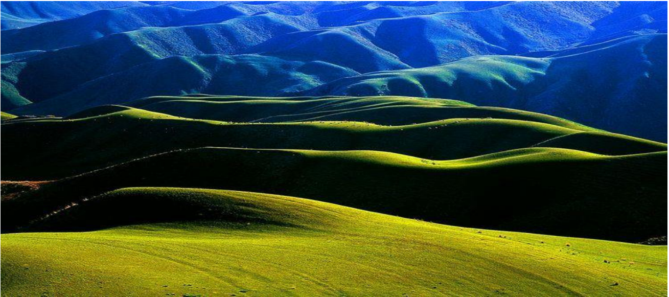
นำท่านเข้าชม ทุ่งหญ้าคาลาจัน โดยใช้รถบริการของอุทยานฯ เพื่อเที่ยวชมทัศนียภาพตามจุดไฮไลต์