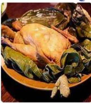
ไก่ฮอกาน