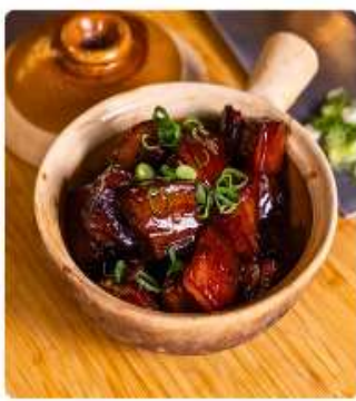
หมูพันปี