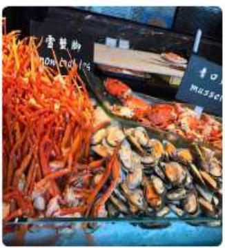
บุฟเฟ่ต์ซีฟู้ด