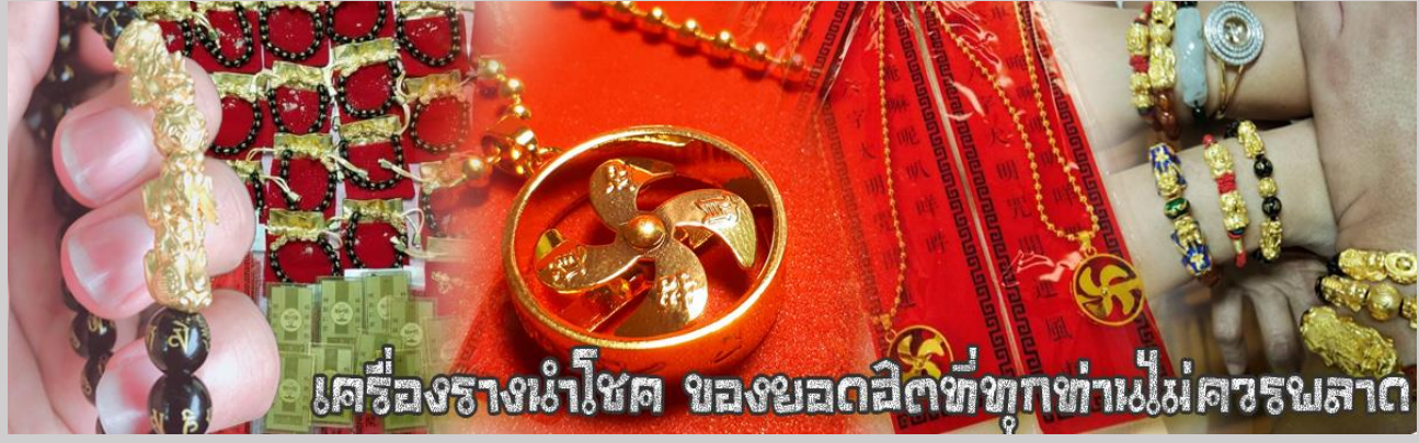
เครื่องรางนำโชค ของยอดเยี่ยมที่ทุกท่านไม่ควรพลาด

จากนั้นนำท่านสู่ ร้านหยก ชมความงามปีเซียะ ที่เชื่อกันว่าเป็นวัตถุมงคลยอดเยี่ยม ที่มีการนำมาบูชา เพื่อให้ช่วยป้องกันสิ่งชั่วร้าย เรียกทรัพย์สินเงินทองให้ไหลมาเทมา และกักเก็บทรัพย์นั้นไม่ให้รั่วไหลออกไปไหนได้ ชาวจีนโบราณเชื่อกันว่า ปีเซียะเป็นสัตว์ประหลาดที่รวมลักษณะของสัตว์มงคลทั้ง 5 ชนิดไว้ด้วยกัน ได้แก่ มังกร พญาราชสีห์หรือสิงโต, อินทรี, กวาง, และแมว โดยตามตำนานเล่าว่า ปีเซียะเป็นลูกมังกรตัวที่ 9 (เทพแห่งโชคลาภ) ของพญามังกรสวรรค์ มีชื่อเรียกด้วยกันหลายชื่อไม่ว่าจะเป็น “เทียนลก (กวางสวรรค์)” เป็นชื่อเดิม ส่วนจีนกวางตุ้งจะเรียกว่า “เผ่เข้า” และคนจีนแต้จิ๋วจะเรียกว่า “ผิซง”