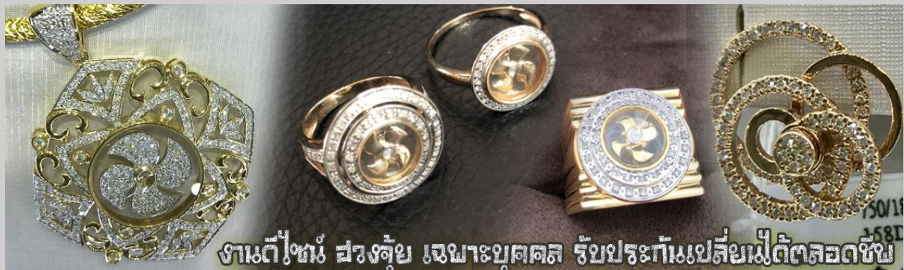
งานดีไซน์ สวยจุ้ย เจาะบุคคผล รัชประเทกันเปลี่ยนไม่ถืดตลอดชีพ

นำท่านเยี่ยมชม โรงงานจิวเวอร์รี่ ที่ขึ้นชื่อของฮ่องกงพบกับงานดีไซน์ที่ได้รับรางวัลอันดับยอดเยี่ยม และใช้ในการเสริมดวง เรื่อง ฮวงจุ้ยนำความโชคดี มั่งคั่งแก่ผู้สวมใส่ ซึ่งในเมืองไทยก็ได้นิยมแพร่หลายออกไป ไม่ว่าจะเป็นกลุ่ม ดารา นักการเมือง พ่อค้าแม่ขายที่ประกอบธุรกิจ เจ้าของกิจการห้างร้านต่าง ๆ ซึ่งเชื่อกันว่าจะนำสิ่งดี ๆ บัดเป่าสิ่งชั่วร้ายให้กับบุคคลที่สวมใส่ ซึ่งจะมีมากมายหลายชนิด เช่นจี้กั๊กหัน แหวนรุ่นต่าง ๆ นาฬิกาข้อมือ (ซึ่งผู้สวมใส่จะได้รับการดูอายุมือจากซินเซปประจำร้าน เพื่อนำวิธีการเสริมดวงในการสวมใส่โดยไม่คิดค่าบริการ)