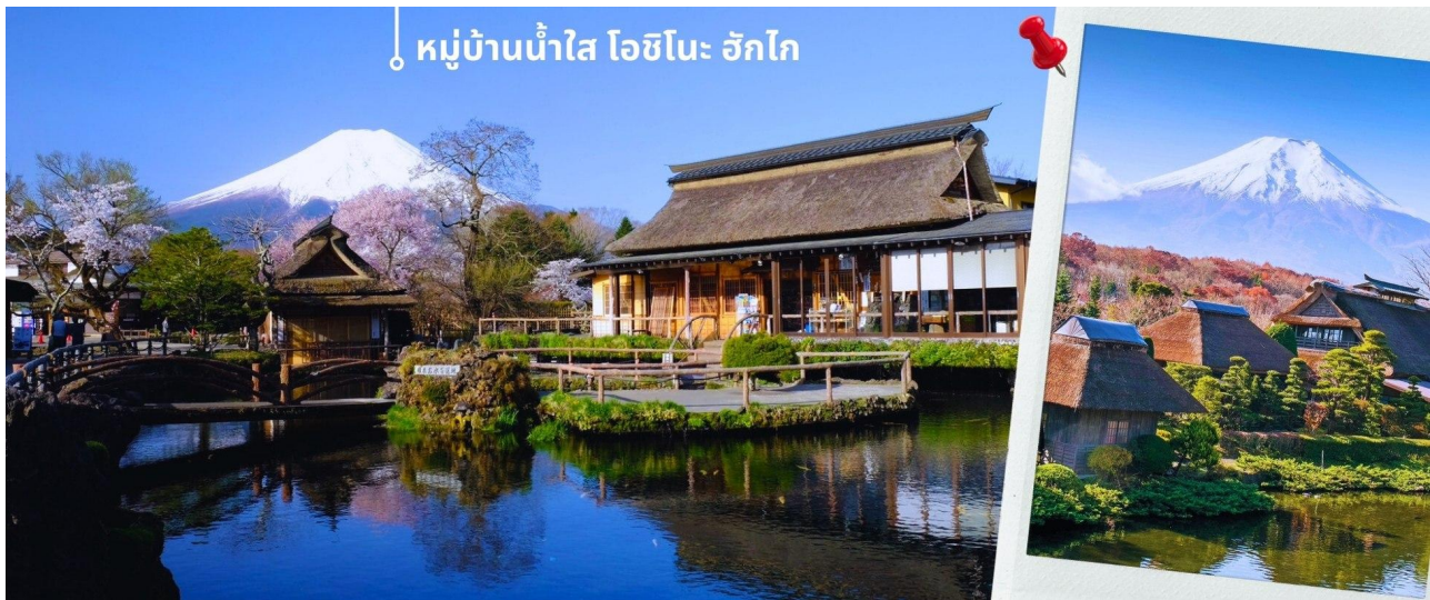
หมู่บ้านน้ำใส โอชิโนะ อักโก

**การมองเห็นวิวภูเขาไฟฟูจิขึ้นอยู่กับสภาพอากาศ** จากนั้นนำท่านแวะชม พิพิธภัณฑสถานแผ่นดินไหว เป็นพิพิธภัณฑสถานี่แสดงถึงผลกระทบจากภัยพิบัติแผ่นดินไหวและการระเบิดของภูเขาไฟ ภายในพิพิธภัณฑสถานมีห้องจัดแสดงข้อมูลการประทุของภูเขาไฟจากทุกมุมโลก โชนความรู้ต่างๆและ โชนข้อปั้งสินค้าญี่ปุ่นอาทิเช่น ผลิตภัณฑ์เครื่องสำอางและของฝากอีกมากมาย เที่ยง รับประทานอาหารเที่ยง ณ ภัตตาคาร (5) หลังรับประทานอาหารเที่ยง พาท่านเดินทางสู่ ทะเลสาบอาชิ ซึ่งเป็นทะเลสาบที่ล้อมรอบไปด้วยธรรมชาติที่อุดมสมบูรณ์และวิวภูเขาฟูจิ เป็นหนึ่งในทะเลสาบที่สวยงามที่สุดในญี่ปุ่น ในประวัติศาสตร์เชื่อกันว่าทะเลสาบแห่งนี้เกิดขึ้นจากการประทุของภูเขาไฟเมื่อประมาณ 3100 ปีก่อน ปัจจุบันเป็นแหล่งท่องเที่ยวในฮาโกเน่ พาท่าน ล่องเรือฮาโกเน่ SORAKAZE โดยเรือลำนี้ได้มีการรีโนเวทใหม่ในชื่อ Hakone Maru และมีการปรับปรุงลักษณะเรือลำใหม่ โดยออกแบบเรือให้มีความเป็นมิตรต่อสิ่งแวดล้อมและเข้ากันกับทิวทัศน์ที่สวยงามของภูเขาไฟฟูจิ รวมถึงใช้เชือกมกมล Mizuhiki ดัดเป็นรูปร่างนกกระเรียน ซึ่งเป็นอัตลักษณ์สำคัญที่สะท้อนถึงความเป็นญี่ปุ่น ภายในห้องโดยสารชั้น 2 ถูกออกแบบมาให้สามารถชมบรรยากาศภายนอกได้อย่างชัดเจนด้วยกระจกบานใหญ่ ชั้นบนถูกแต่งให้เหมือนสวนสาธารณะ ทั้งกระถางต้นไม้ ม้านั่ง ชิงช้า ให้ท่านได้ชมวิวทิวทัศน์และธรรมชาติรอบๆทะเลสาบ และในวันที่ฟ้าเปิดยังสามารถมองเห็นฟูจิซึ่งจากตรงนี้ได้อีกด้วย โดยจะล่องจากท่าเรือ HAKONE SEKISHO - ท่าเรือ MOTOHAKONE ก่อนจะพาท่านขึ้นฝั่ง **การมองเห็นวิวภูเขาไฟฟูจิขึ้นอยู่กับสภาพอากาศ**