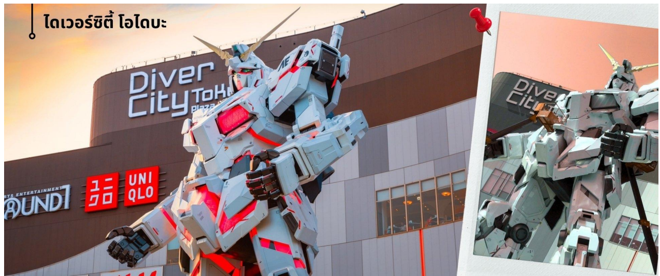
ไทเวอร์ซิตี โอโดะ

นำท่านเข้าสู่ที่พัก HEDISTAR HOTEL NARITA หรือเทียบเท่า วันที่สี่ อิสระซอปปิงตามอัยาศัย หรือเที่ยวสวนสนุกโตเกียวดิสนีย์แลนด์ เช้า รับประทานอาหารเช้าที่ โรงแรม (6) หลังรับประทานอาหารเช้า อิสระให้ทุกท่านได้เดินเล่น ชมวิว ซอปปิง เมืองโตเกียว หรือ เลือกซื้อบัตรเข้าสวนสนุก Tokyo Disneyland