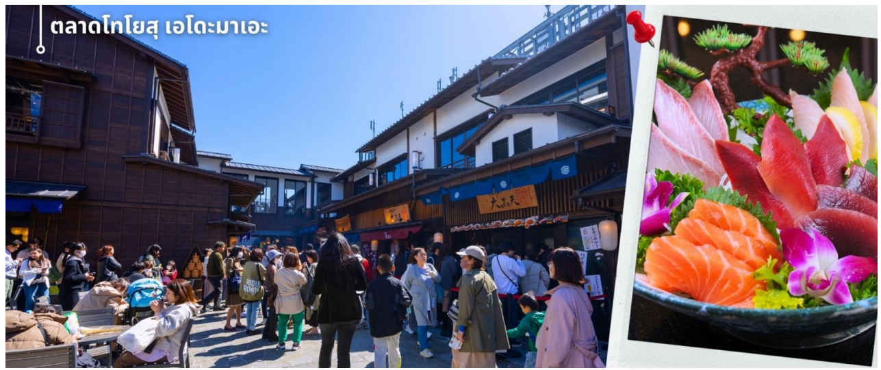
ตลาดโทโยสุ เอโดะมาเอะ

พาท่านเดินทางสู่ โทโยสุ เซนเคียคุ บันไร Toyosu Senkyaku Banrai Complex เป็นสถานที่เที่ยวอีกแห่งที่เพิ่งเปิดให้บริการ ภายในจะมีตลาด ตลาดโทโยสุ เอโดะมาเอะ ซึ่งเป็นตลาดสไตล์เอโดะย้อนยุค เป็นสถานที่ท่องเที่ยวใหม่ที่ตั้งอยู่ในย่านโทโยสุ ของโตเกียว ตั้งอยู่ตรงข้ามตลาดปลาโทโยสุ เป็นตลาดที่สร้างขึ้นในสมัยย้อนยุคราวกับสมัยเอโดะ Toyosu Edomae Market เป็นตลาดที่มีทั้งอาหารทะเลสดใหม่จากตลาดปลาโทโยสุ และอาหารญี่ปุ่นหลากหลายชนิด