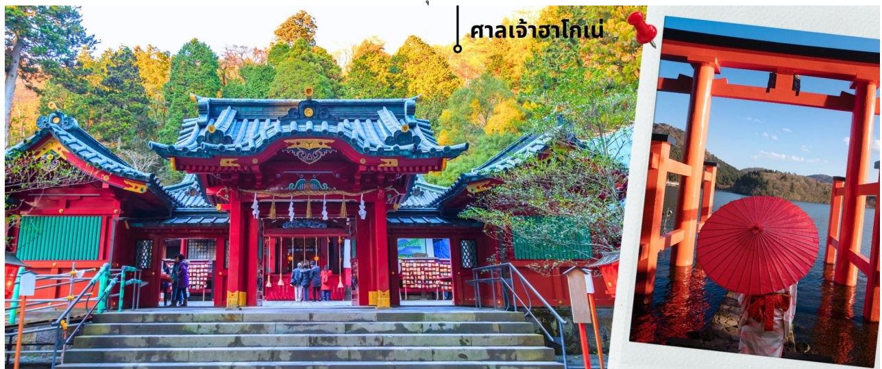
ศาลเจ้าฮาโกเน่

เพื่อเดินทางไหว้ขอพรกันต่อที่ ศาลเจ้าฮาโกเน่ Hakone Shrine ก่อตั้งขึ้นในปี ค.ศ. 757 ในรัชสมัยของจักรพรรดิ โคโช เป็นหนึ่งในศาลเจ้าที่ในอดีตเหล่าขุนพลแคว้นเวียนมาที่นี้เพื่อมาสดภาวนา เนื่องจากมีความเชื่อว่าศาลเจ้าแห่งนี้จะ นำโชคลาภในเรื่องของการต่อสู้ ทำให้ศาลเจ้าแห่งนี้มีชื่อเสียงโด่งดังไปทั่วประเทศ และยังได้รับการขึ้นทะเบียนในปี ค.ศ. 1875 ให้เป็นศาลเจ้าลำดับที่ 3 ในบรรดาศาลเจ้าแห่งชาติของญี่ปุ่น ปัจจุบันนี้ผู้คนนิยมมาสักการะขอพรในเรื่องของการ เดินทางให้แคล้วคลาด รวมไปถึงเรื่องการคลอดบุตรให้ปลอดภัย