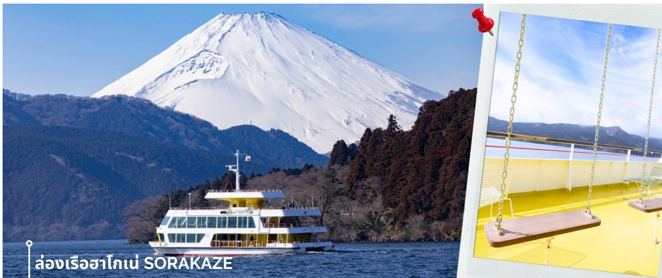
ล่องเรือฮาโกเน่ SORAKAZE

**การมองเห็นวิวภูเขาไฟฟูจิขึ้นอยู่กับสภาพอากาศ** จากนั้นนำท่านแวะชม พิพิธภัณฑสถานแผ่นดินไหว เป็นพิพิธภัณฑสถานี่แสดงถึงผลกระทบจากภัยพิบัติแผ่นดินไหวและการระเบิดของภูเขาไฟ ภายในพิพิธภัณฑสถานมีห้องจัดแสดงข้อมูลการประทุของภูเขาไฟจากทุกมุมโลก โชนความรู้ต่างๆและ โชนข้อปั้งสินค้าญี่ปุ่นอาทิเช่น ผลิตภัณฑ์เครื่องสำอางและของฝากอีกมากมาย เที่ยง รับประทานอาหารเที่ยง ณ ภัตตาคาร (5) หลังรับประทานอาหารเที่ยง พาท่านเดินทางสู่ ทะเลสาบอาชิ ซึ่งเป็นทะเลสาบที่ล้อมรอบไปด้วยธรรมชาติที่อุดมสมบูรณ์และวิวภูเขาฟูจิ เป็นหนึ่งในทะเลสาบที่สวยงามที่สุดในญี่ปุ่น ในประวัติศาสตร์เชื่อกันว่าทะเลสาบแห่งนี้เกิดขึ้นจากการประทุของภูเขาไฟเมื่อประมาณ 3100 ปีก่อน ปัจจุบันเป็นแหล่งท่องเที่ยวในฮาโกเน่ พาท่าน ล่องเรือฮาโกเน่ SORAKAZE โดยเรือลำนี้ได้มีการรีโนเวทใหม่ในชื่อ Hakone Maru และมีการปรับปรุงลักษณะเรือลำใหม่ โดยออกแบบเรือให้มีความเป็นมิตรต่อสิ่งแวดล้อมและเข้ากันกับทิวทัศน์ที่สวยงามของภูเขาไฟฟูจิ รวมถึงใช้เชือกมกมล Mizuhiki ดัดเป็นรูปร่างนกกระเรียน ซึ่งเป็นอัตลักษณ์สำคัญที่สะท้อนถึงความเป็นญี่ปุ่น ภายในห้องโดยสารชั้น 2 ถูกออกแบบมาให้สามารถชมบรรยากาศภายนอกได้อย่างชัดเจนด้วยกระจกบานใหญ่ ชั้นบนถูกแต่งให้เหมือนสวนสาธารณะ ทั้งกระถางต้นไม้ ม้านั่ง ชิงช้า ให้ท่านได้ชมวิวทิวทัศน์และธรรมชาติรอบๆทะเลสาบ และในวันที่ฟ้าเปิดยังสามารถมองเห็นฟูจิซึ่งจากตรงนี้ได้อีกด้วย โดยจะล่องจากท่าเรือ HAKONE SEKISHO - ท่าเรือ MOTOHAKONE ก่อนจะพาท่านขึ้นฝั่ง **การมองเห็นวิวภูเขาไฟฟูจิขึ้นอยู่กับสภาพอากาศ**