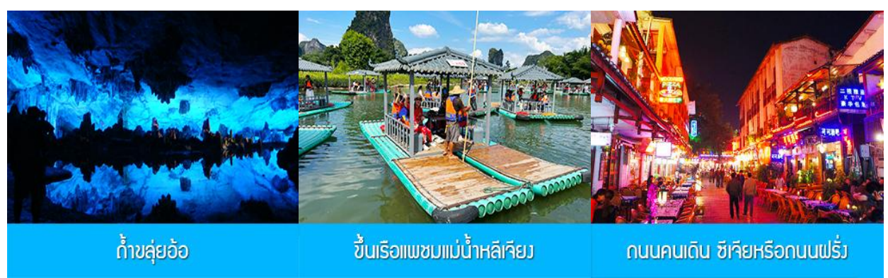
ถ้ำขลุ่ยอ้อ

หลังอาหารนำท่านเที่ยวชม เจดีย์เงิน เจดีย์ทอง 金银双塔 แลนด์มาร์คที่โดดเด่นและขึ้นชื่อของเมืองกุ้ยหลิน เจดีย์เงิน เจดีย์ทองเป็นเจดีย์คู่ที่ถูกสร้างขึ้นกลางน้ำ ได้รับการขนานนามว่าเป็นเจดีย์สุริยัน และเจดีย์จันทร์ธา โดย เจดีย์สุริยันเป็นเจดีย์ทองสัมฤทธิ์ ที่สูงที่สุดในโลกด้วยความสูงถึง 42 เมตร ทำด้วยทองสัมฤทธิ์กว่า 600 ตัน ส่วน เจดีย์เงินนั้นทำด้วยหินแกรนิตและตกแต่งด้วยแผ่นกระเบื้อง จุดนี้เป็นจุดที่ต้องแวะสำหรับผู้ที่มาเยือนเมืองกุ้ย หลินทุกคนและได้กลายเป็นจุดเช็คอินยอดนิยมในปัจจุบัน..... พักที่ GUILIN VIENNA HOTEL โรงแรมระดับ 4 ดาวท้องถิ่น หรือเทียบเท่าในเมืองกุ้ยหลิน