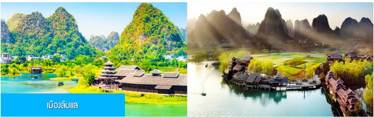
เมืองลับแล