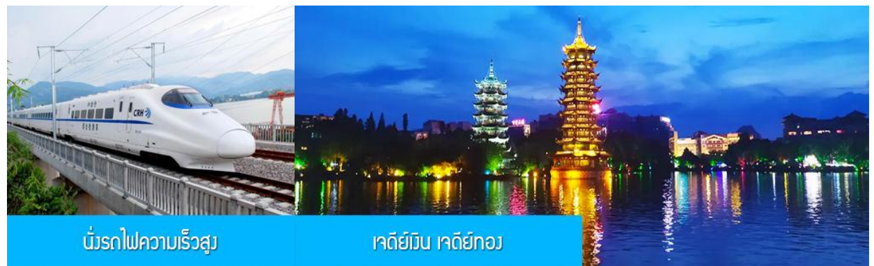
นิ้รถไฟความเร็วสูง