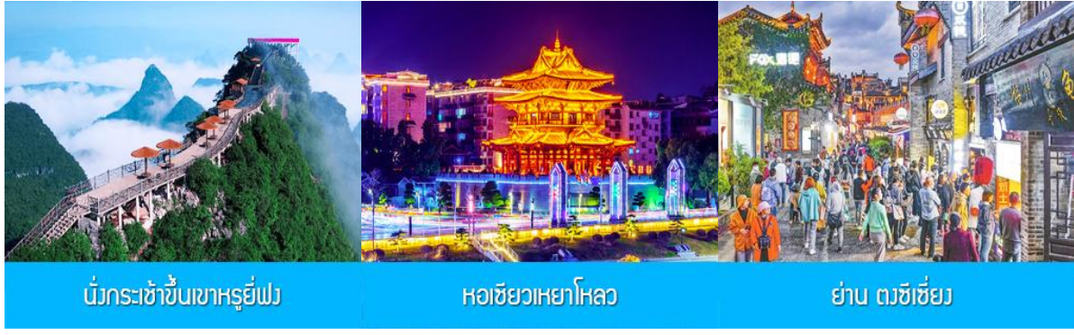
นั่งกระเช้าขึ้นเขาหญู่ยู่ฟง

พักที่ YANGSHUO ELITE GARDEN HOTEL ระดับ 4 ดาวท้องถิ่นหรือเทียบเท่าใน เมืองหยางชว่