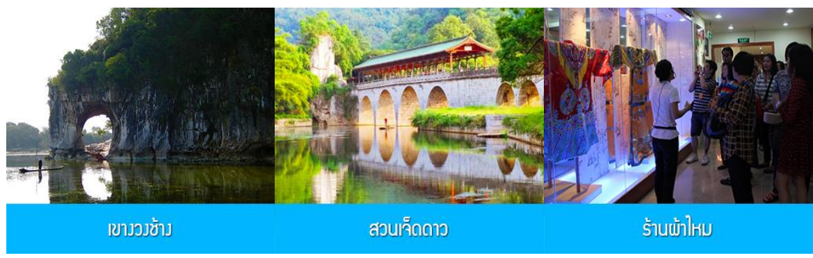
เขาวงช้าง

พักที่ GUILIN VIENNA HOTEL โรงแรมระดับ 4 ดาวท้องถิ่น หรือเทียบเท่าในเมืองกุ้ยหลิน