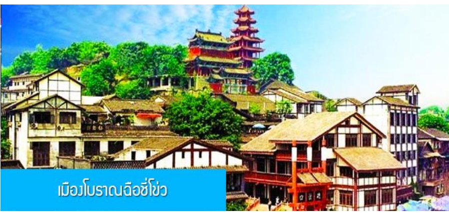
เมืองโบราณฉือชัว

พักที่ BORRMAN HOTEL โรงแรมระดับ 4 ดาวหรือเทียบเท่าในเมืองฉงชิ่ง