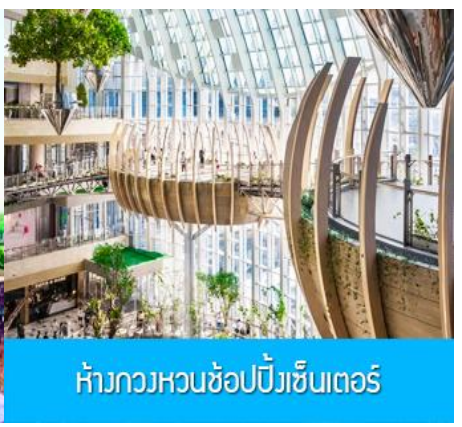
ห้างกวงหวนช้อปปิ้งเซ็นเตอร์