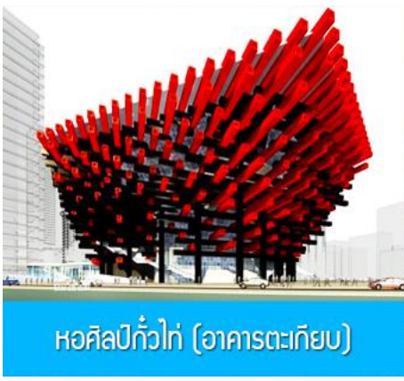
หอศิลป์แก้ว (อาคารตะเกียบ)