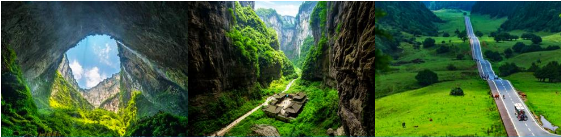
อุทยานหลุมฟ้า