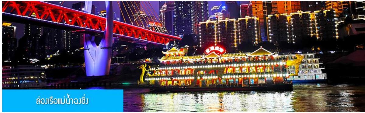
ล่องเรือแม่น้ำจิ่ง

OPTIONAL TOUR ไกด์ขายนล่องเรือแม่น้ำจิ่ง ชมความสวยงามของสองริมฝั่งแม่น้ำเมืองจิ่ง ล่องเรือ ท่านละ 280 หยวน หรือประมาณ 1,400 บาท