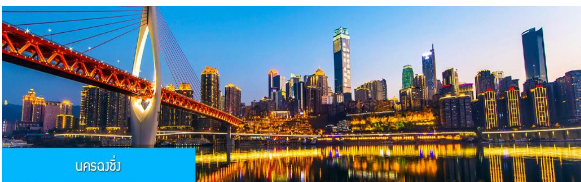
นครฉงชิ่ง