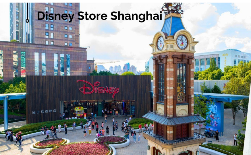
Disney Store Shanghai

จากนั้น ผ่านชมหอไข่มุก เป็นหอส่งสัญญาณวิทยุโทรทัศน์สูง 468 เมตร ลักษณะเป็นไข่มุก 11 ลูก และ เสา 3 เสา ด้านบนเป็นรูปไข่มุก 3 เม็ด 3 ขนาดเรียงกันในแนวตั้ง หลังรับประทานอาหารเที่ยง นำท่านเดินทางสู่ Disney Flagship Store Shanghai เป็นร้านที่มีทั้ง ตุ๊กตา และของที่ระลึกจากตัวละคร คาแรคเตอร์ต่างๆจากดิสนีย์แบบลูกลิขสิทธิ์ มีขนาดใหญ่กว่าร้านในสวนสนุก Disney land เหมาะสำหรับท่านที่ชอบสะสมของจากดิสนีย์ มีคาแรคเตอร์ตัวละครมากกว่า 2,000 รายการ เช่น มิกกัมินนี่ STAR WAR MARVEL และเหล่าเจ้าหญิงดิสนีย์ ทั้ง แอเรียล เจ้าหญิงนิทรา สโนว์ไวท์ และอื่นๆ และให้ท่านได้ช้อปปิ้งตามอัธยาศัย