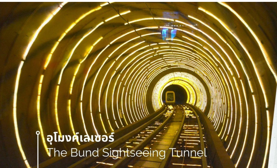
อุโมงค์เลเซอร์ The Bund Sightseeing Tunnel