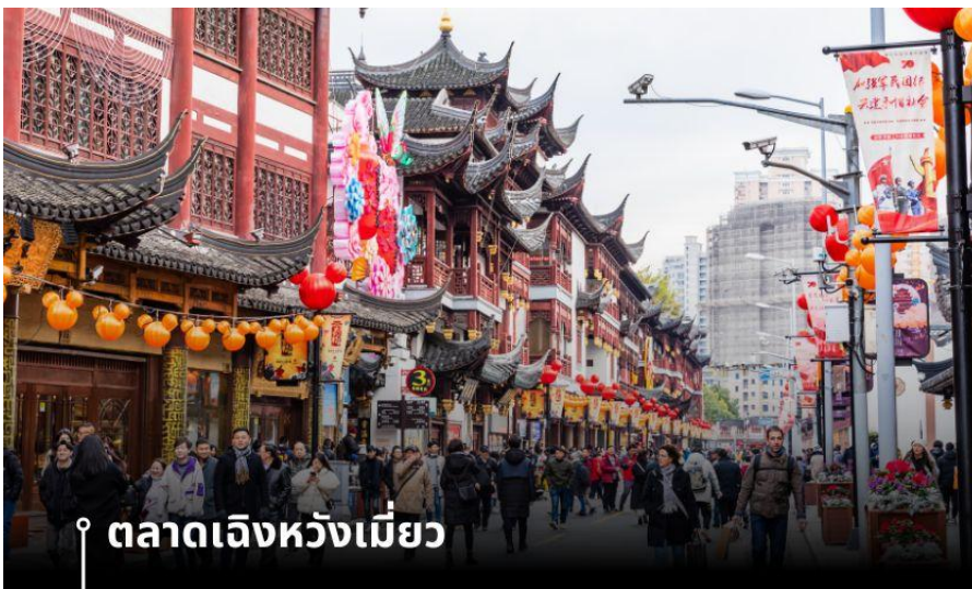
ตลาดเจิ้งหวังเมี่ยว

จากนั้นนำท่านชม ตลาดเจิ้งหวังเมี่ยว หรือเป็นที่รู้จักในชื่อ ตลาด 100 ปี เติ่นหวังเมี่ยว เมืองเซี่ยงไฮ้ (Chen Wang Miao) ถือว่าเป็นตลาดเก่าของผุ่ตง เมืองเซี่ยงไฮ้ อาคารบ้านเรือนบริเวณนี้เป็นสถาปัตยกรรมโบราณสมัยราชวงศ์หมิงและชิง ตกแต่งสไตล์สถาปัตยกรรมแบบโบราณจีน และเก่ากว่าร้อยปี