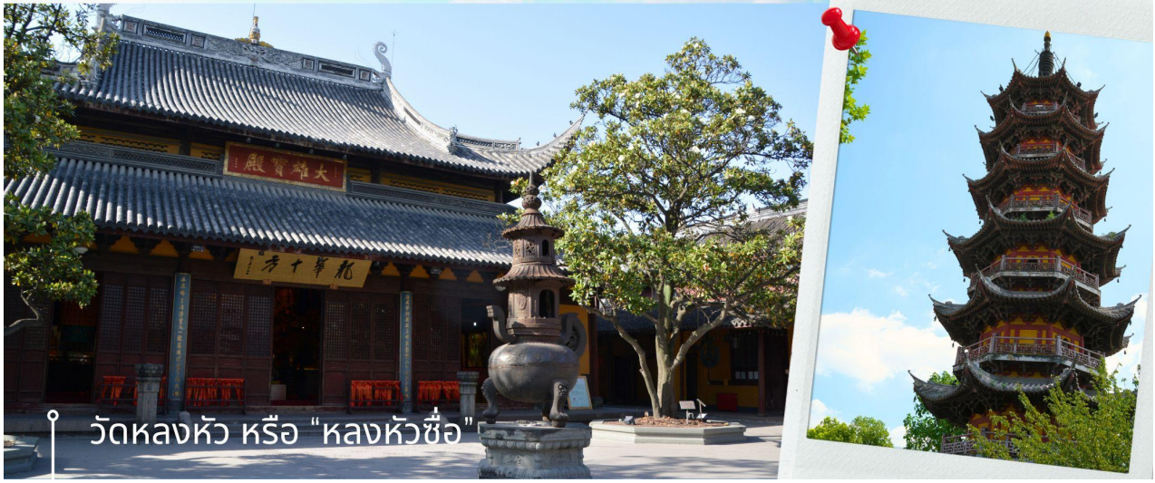
วัดหลงหัว หรือ "หลงหัวซื่อ"

เที่ยง รับประทานอาหารกลางวัน ณ ภัตตาคาร (9) สมควรแก่เวลาเดินทางสู่สนามบินนานาชาติผู้ตงเซี่ยงไฮ้ เพื่อกลับกรุงเทพฯ โดยสายการบิน Shanghai Airlines 14.35 น. ออกเดินทางสู่ กรุงเทพฯ โดยสายการบิน Shanghai Airlines เที่ยวบินที่ FM855 18.05 น. ถึง กรุงเทพฯ โดยสวัสดิภาพ พร้อมความประทับใจ