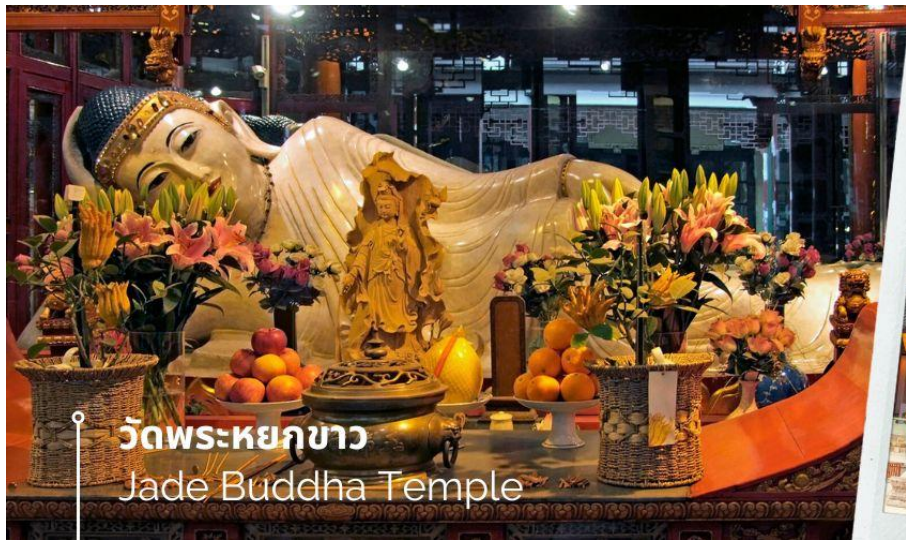
วัดพระหยกขาว Jade Buddha Temple