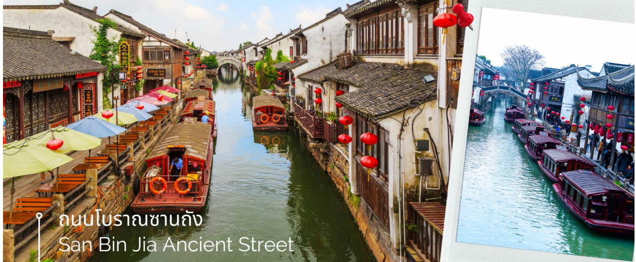
ถนนโบราณชานฉิง San Bin Jia Ancient Street

แหล่งท่องเที่ยวระดับ AAAA ของประเทศ ถนนชานฉิงในปัจจุบันยังคงไว้ด้วยสถาปัตยกรรมจีนแบบดั้งเดิม บรรยากาศของถนนการค้าเก่าแก่ อาคารบ้านเรือนจำนวนมากถูกดัดแปลงเป็นร้านค้าที่ขายทั้งงานหัตถกรรม ของที่ระลึก และอาหารท้องถิ่น นอกจากนี้ยังมีร้านน้ำชาและร้านอาหารสไตล์ตะวันตกอีกด้วย ให้ท่านได้สัมผัสสัมผัสบรรยากาศและ ช้อปปิ้ง สินค้า และอาหารตามอัธยาศัย ได้เวลาอันสมควรนำท่านกลับเมืองเชียงใหม่