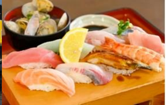
กลางวัน รับประทานอาหารกลางวัน ณ ภัตตาคาร