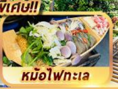
หม้อไฟทะเล