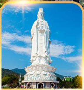
วัดหลินอิ่ง