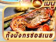
กุ้งมังกรชอสเนซ