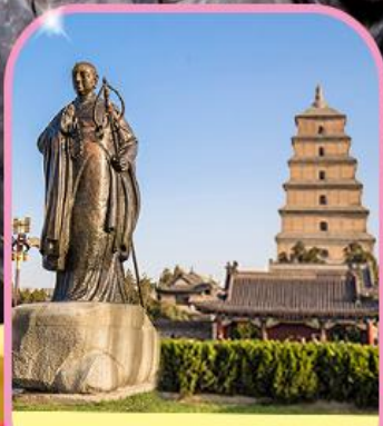
เจดีย์ห่านป่าใหญ่