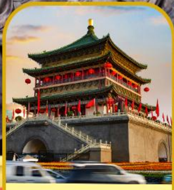
จัตุรัสหอกลอง หอระฆัง