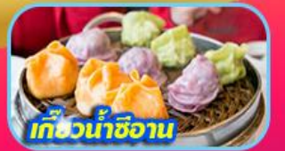
เกี๊ยวน้ำซีอาน