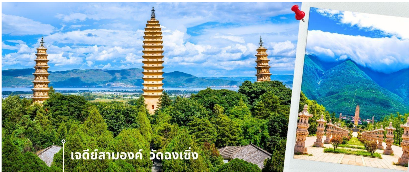
เจดีย์สามองค์ วัดจงเซิ่ง

จากนั้นผ่านชม เจดีย์สามองค์ สัญลักษณ์ของเมืองต้าหลี่ ตั้งอยู่ภายใน วัดจงเซิ่ง (Chongsheng Temple) วัดเก่าแก่ที่สร้างขึ้นเมื่อศตวรรษที่ 9 นับว่าเป็นหนึ่งในเจดีย์ที่สูงที่สุดในประเทศจีน อีกทั้งยังมีความศักดิ์สิทธิ์เป็นอย่างมาก ว่ากันว่า เป็นหนึ่งในสิ่งก่อสร้างเพียงไม่กี่แห่งที่ไม่ถูกทำลายจากเหตุการณ์แผ่นดินไหวในเมืองต้าหลี่เมื่อปี ค.ศ. 1925 จึงกลายเป็นสถานที่เคารพศรัทธาของชาวต้าหลี่เป็นอย่างมาก