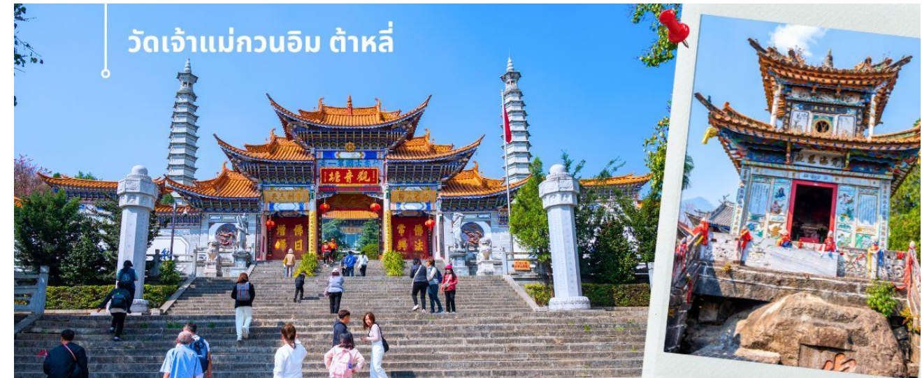
วัดเจ้าแม่กวนอิม ต้าหลี่

ก่อนจะนำท่านชม วัดเจ้าแม่กวนอิม (ใช้เวลาเดินทาง 30 นาที) ตามตำนานเล่าว่าเจ้าแม่กวนอิมได้แปลงกายเป็นหญิงชราแบกก้อนหินใหญ่ไว้บนหลังเพื่อให้ทหารของฝ่ายตรงข้ามได้เห็นเมื่อทหารฝ่ายศัตรูได้เห็นว่าแม่แต่หญิงชรายังแข็งแรงถึงเพียงนี้ ถ้าเป็นคนวัยหนุ่มสาวจะต้องมีพลังกำลังมากมายยากที่จะต่อสู้อ จึงทำให้ไม่ทำการเข้าโจมตีเมืองและถอยทัพกลับไป ชาวเมืองจึงสร้างวัดแห่งนี้ขึ้นในสมัยราชวงศ์ถัง ซึ่งถือว่าเป็นวัดที่มีประติมากรรมยอดเยี่ยมแห่งหนึ่งในต้าหลี่