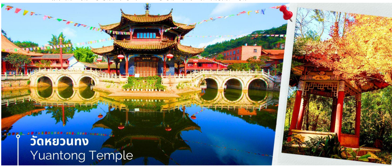
วัดหยวนทง Yuantong Temple

นำท่านชม วัดหยวนทง (Yuantong Temple) วัดแห่งนี้เป็นวัดที่ใหญ่และเก่าแก่ที่สุดในเมืองคุนหมิง สร้างมาตั้งแต่สมัยราชวงศ์ถัง มีอายุยาวนานประมาณ 1,200 กว่าปี การสร้างวัดแห่งนี้จะแปลกตากว่าวัดอื่นในจีน เพราะปกติแล้วการสร้างวัดของจีนส่วนมากจะต้องสร้างอยู่บนภูเขา แต่วัดหยวนทงสร้างวัดต่ำกว่าภูเขา โดยวิหารจะอยู่ต่ำที่สุด เนื่องจากวัดแห่งนี้ไม่ได้สร้างขึ้นเพื่อเป็นวัดโดยตรง แต่เคยเป็นศาลเจ้าแม่กวนอิมมาก่อน