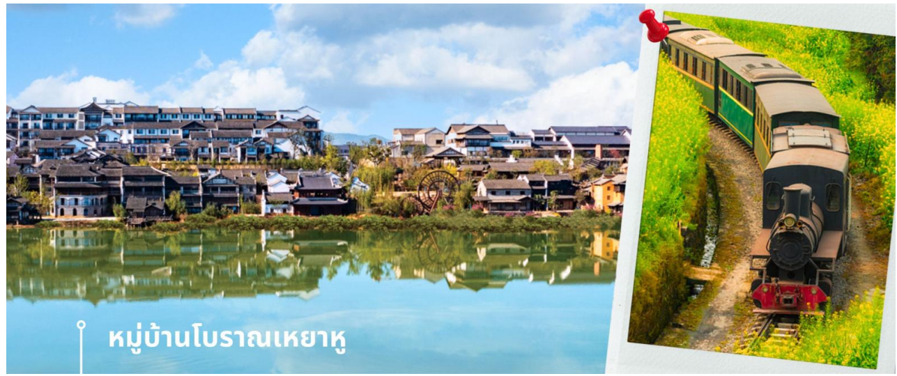
หมู่บ้านโบราณเหยาหู

หลังรับประทานอาหารเช้า ให้อ่านให้ใช้เวลาเพลิดเพลิน ไปกับการถ่ายรูปในมุมต่างๆ และกิจกรรมที่น่าสนใจในหมู่บ้าน เหยาหู จากนั้น ชมโชว์ในหมู่บ้านเหยาหู เป็นโชว์วัฒนธรรมพื้นเมือง และศิลปะการแสดงต่างๆภายในหมู่บ้าน