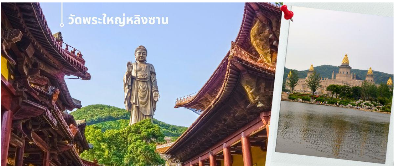
วัดพระใหญ่หลิงชาน

หลังรับประทานอาหารเที่ยง นำท่านเดินทางสู่ เมืองอู่ซี นำท่านชม วัดพระใหญ่หลิงชาน (นั่งรถราง) ตั้งอยู่ที่เมืองอู่ซี มณฑลเจียงซู ประเทศจีน สิ่งที่เห็นแบบเด่นชัดเมื่อมาเที่ยวที่วัดนี้คือ “หลิงชานต้าฝอ” หรือ “พระใหญ่หลิงชาน” พระพุทธรูปองค์ใหญ่ที่ใหญ่ที่สุดองค์หนึ่งในประเทศจีนและในโลก เป็นพระพุทธรูปปางยืนของพระอมิตาภพุทธะแบบ สัมฤทธิ์กลางแจ้ง หนักกว่า 7,000 เมตริกตัน สร้างเสร็จเมื่อปลายปี ค.ศ. 1996 มีความสูงกว่า 88 เมตร (289 ฟุต) รวม ฐานบัว 9 เมตร นักท่องเที่ยวทั้งชาวจีนและชาวต่างชาตินิยมมาขอพรเพื่อความสิริมงคลและความสำเร็จในหน้าที่การงาน การเดินทางให้แคล้วคลาดปลอดภัย โดยการกราบและลูบที่เท้าท่าน ซึ่งภายในพระพุทธรูปยังมีพิพิธภัณฑ์ชีวประวัติของท่านให้ได้เรียนรู้อีกด้วย ภายในประกอบไปด้วย ตำหนักผานกง หรือ ศาลาผานกง ตั้งอยู่ที่ริมทะเลสาบไท่หู ทาง ตะวันออกของพุทธอุทยาน ก่อสร้างราวปี 2006 บนเนื้อที่กว่า 7 หมื่นตารางเมตร เป็นที่รวมของศิลปวัฒนธรรมอัน หลากหลายของพุทธศาสนาในแต่ละนิกายและแต่ละประเทศได้อย่างงดงามลงตัว จนถูกเรียกขานว่าเป็น “พิพิธภัณฑ์ พุทธศิลป์ร่วมสมัยแห่งประเทศจีน” เพราะเป็นที่รวมของพิพิธภัณฑ์ นิทรรศการ โรงละคร คอนเสิร์ต และงานพุทธศิลป์ มากมาย ที่น่าตื่นตาตื่นใจ