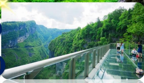
ระเบียงกระจกอุโมง