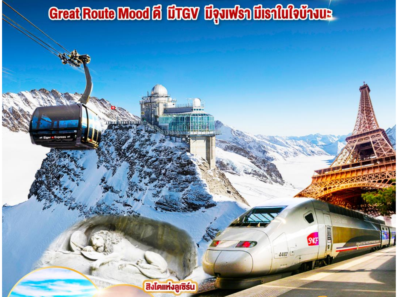
สิงโตแห่งลูซิิร์น

Great Route Mood ดี มีTGV มีจุฬาราม มีเราในใจบ้างนะ