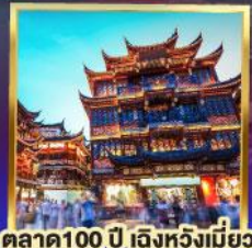
เมืองโบราณจูเจียเจี้ยว