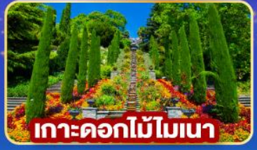
เกาะดอกไม้โมเนา