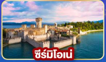
ซิริมิโอนี