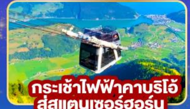
กระเช้าไฟฟ้าคาบรีโอ สู่สาคเตนเซอร์ฮอร์น

🍴 พิเศษ! พิชิตยอดเขาดีอาโวลูชา พร้อมเมนูกะเพราไทย