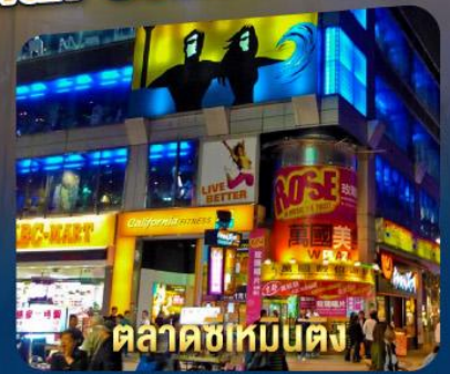
ตลาดซีเหมินติง