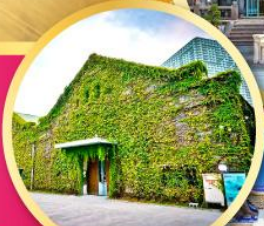
Huashan 1914 Creative Park