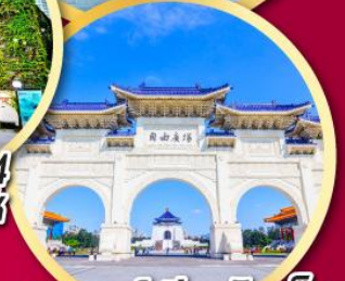
อนุสรณ์เจียงไคเช็ค