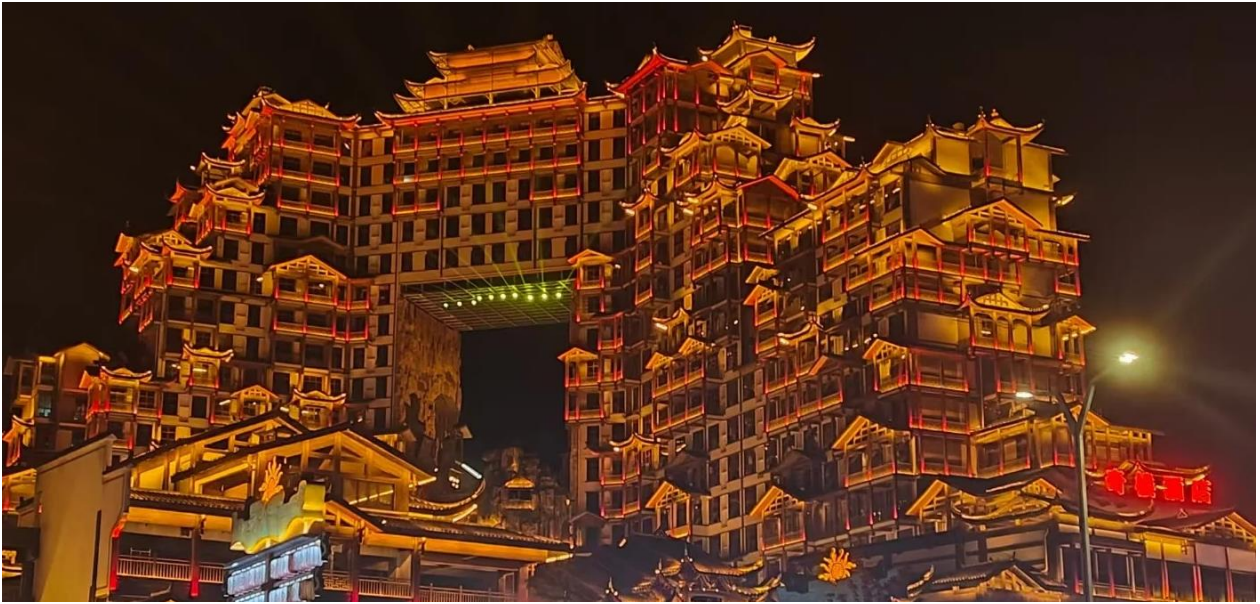
ที่พัก COUNTRY GARDEN PHOENIX HOTEL หรือเทียบเท่าระดับ 5 ดาว (มาตรฐานประเทศจีน)

วันที่สอง บ้านเจ้าเมืองถู่เจีย – เขาเทียนเหมินซาน (รวมกระเช้าขึ้นลง) – ระเบียบแก้ว (รวมผ้าห่มรองเท้า) - บ้านไฉ่ เลื่อน 99 ชั้น - ถ้ำประตูสวรรค์ - โข่วจิ้งจอกขาว