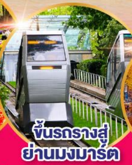
ขึ้นรางสู่ ย่านมงมาร์ต