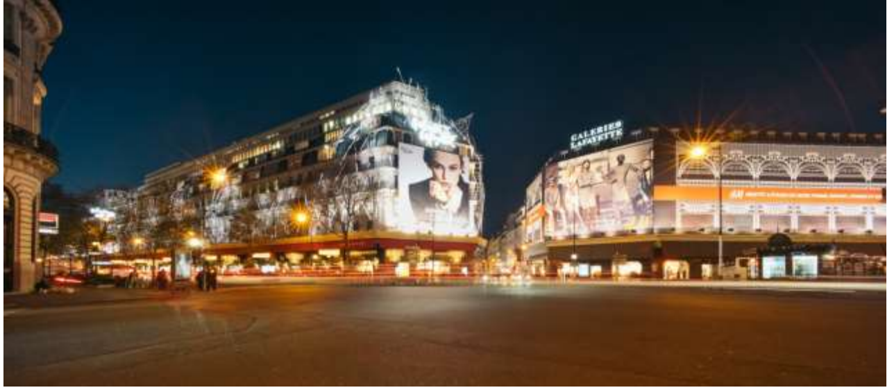
จากนั้นสินค้าแบรนด์เนมชื่อดังที่ห้างสรรพสินค้า แกลลารี-ลาฟาแยตต์ Galerie Lafayette

เช้า บริการอาหารเช้า ณ ห้องอาหารของโรงแรมที่พัก นำท่านช้อปปิ้งสินค้าปลอดภาษีที่ Duty Free อิสระกับการ ช้อปปี้งสินค้าตามรสนิยมแบรนด์ชื่อดังนานาชนิด อาทิ น้ำหอม เสื้อผ้า กระเป๋า กระเป๋าเดินทาง เครื่องสำอาง เที่ยง อิสระกับอาหารมื้อกลางวันเพื่อความสะดวกในการช้อปปิ้งของท่าน