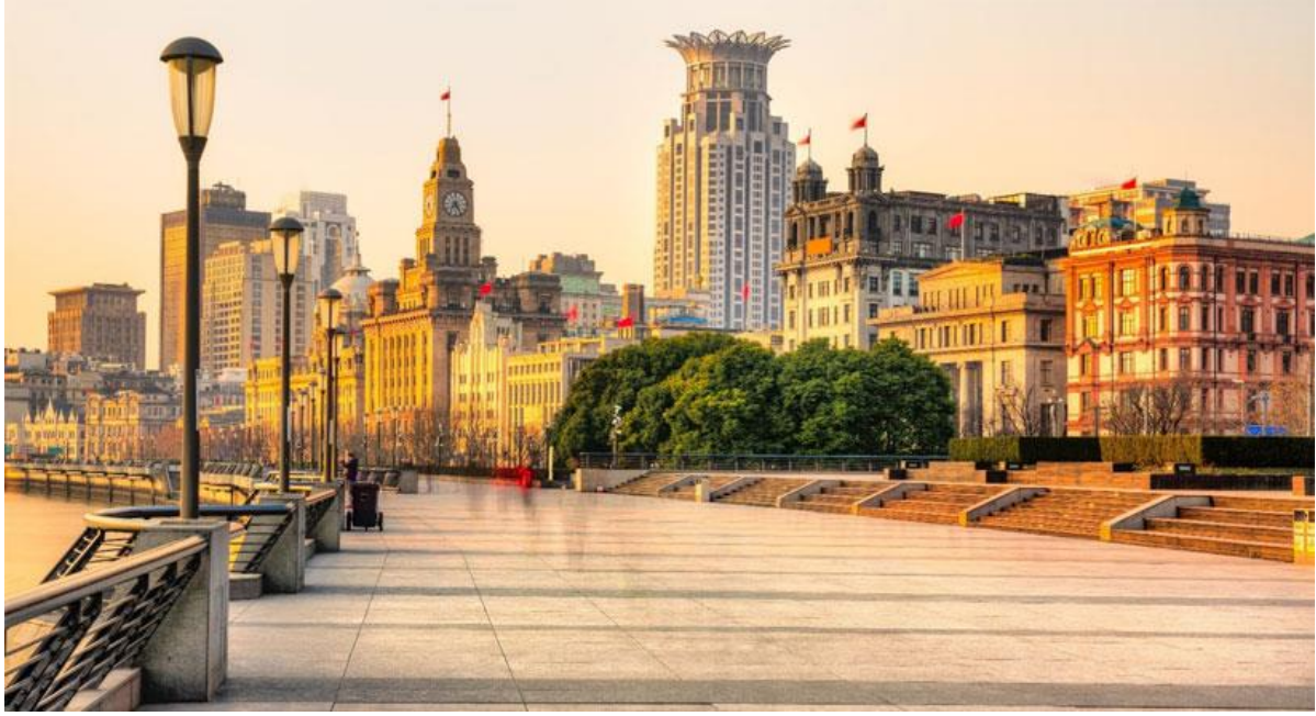
นำท่านเดินทางสู่ ท่าเรือข้ามสู่ฝั่งผุดง ให้ท่านได้ชมทัศนียภาพและแสงสียามค่ำคืน นำท่านบันทึกภาพประทับใจกับ หอไข่มุก (ด้านนอก)

ได้เวลานำท่านสู่บริเวณ หาดไวท์ตัน หรือ หาดเจ้าพ่อเชียงใหม่ ตั้งอยู่บนฝั่งตะวันตกของแม่น้ำหวงผู้มีความยาวจากเหนือจรดใต้ถึง 4 กิโลเมตร เป็นเขตสถาปัตยกรรมที่ได้ชื่อว่า " พิพิธภัณฑ์สิ่งก่อสร้างหมื่นปีแห่งชาติจีน " ถือเป็นสัญลักษณ์ที่โดดเด่นของนครเชียงใหม่