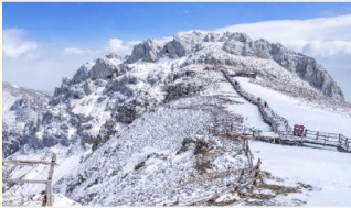
ภูเขาหิมะสี่ขา