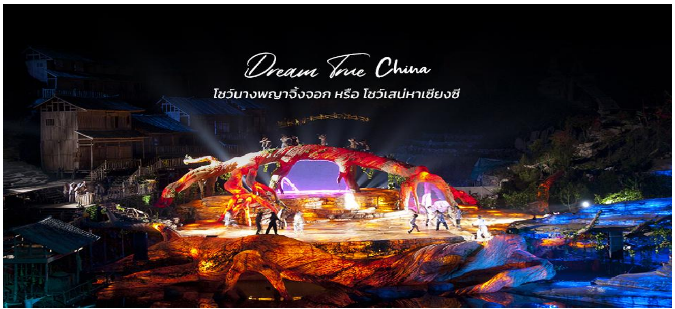
Dream True China ไขว้นางพญาจิ้งจอก หรือ ไขว้เส่นหาเซียงซี

AD-CSX022-VZ_CHANGSHA-FURONGZHEN_5D4N_MAR-DEC 2025