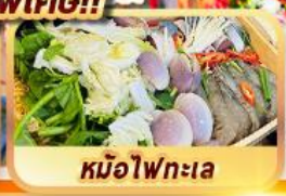
หม้อไฟทะเล