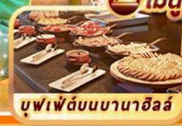
บุฟเฟ่ต์บนบานาฮิลล์