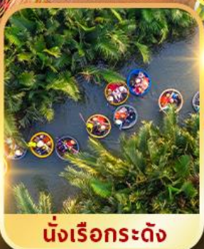
นั่งเรือกระดัง