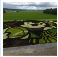
ศิลปะบนนาข้าว