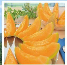
ศูนย์จำหน่ายเมล่อนยูบาริ