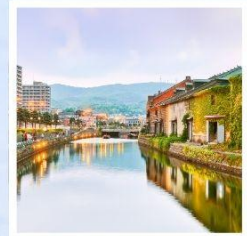
เมืองโอตารุ