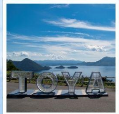
จุดชมวิวโซโตะ

ชมวิวยอดเยี่ยมที่สวนบนทะเลสาบโทยะ ณ จุดชมวิวโซโตะ เมืองสุดแสนโรแมนติก กับถนนสายของหวานชื่อดัง โอตารุ ศิลปะบนนาข้าว เรืองราวในทุกนาสะท้อนจิตวิญญาณแห่งฮอกไกโด ที่ 1 ปี มีครั้งเดียว กิน กิน และ กิน จุใจไปกับเมล่อนเย็นฉ่ำแบบไม่อื่น ชมฟาร์มโคนมชื่อดัง นิเซโกะ ทาคาฮาชิ กับวิวโยเทแสนพิเศษ สวนดอกไม้กับวิวเทือกเขาที่โด่งดังที่สุดแห่งฮอกไกโด ณ สวนชิชิโนะโอะกะ พักออนเซ็น 1 คืน!!! พักในเมืองซัปโปโร 2 คืน เมนูพิเศษ...บุฟเฟ่ต์เมล่อน, บุฟเฟ่ต์ชาบู, บุฟเฟ่ต์ซาบู, บุฟเฟ่ต์บึงย่าง กรุ๊ปสบายๆ เพียง 20 ท่านเท่านั้น!!!