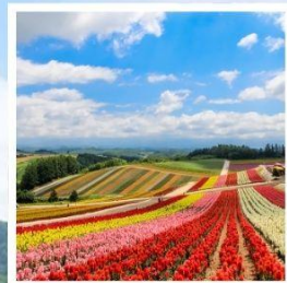
สวนดอกไม้ชิชิโนะโอะกะ