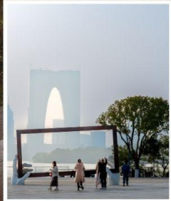
SUZHOU LARGE PHOTO FRAME