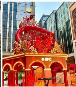
THE BUND WEEKEND MARKET BFC