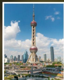
ตึกหอไข่มุก