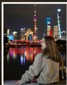
เซี่ยงไฮ้ คลาสสิก ไนท์