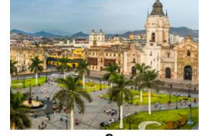
กรุงลิมา

xx.xx น. ออกเดินทางสู่กรุงลิมา เที่ยวบิน... xx.xx น. เดินทางถึงสนามบินลิมา ประเทศเปรู