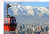
นั่งกระเช้าขึ้นสู่เนินเขาซานต้า ลูเซีย

xx.xx น. ออกเดินทางสู่เมืองปุนตาอาเรเนส เที่ยวบิน... xx.xx น. เดินทางถึงสนามบินปุนตาอาเรเนส ** พักที่ Novotel Las Condes Hotel 4* หรือเทียบเท่า **