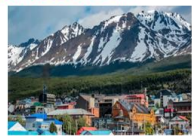
เมืองเอลคาลาฟาเต

** พักที่ Xelena Hotel 4* หรือเทียบเท่า **