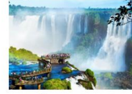
จุดชมวิว Devil's Throat

DAY5 อุทยานแห่งชาติอิกวาซู (ฝั่งอาร์เจนตินา)