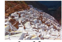
เมืองเกลิอโบราวม