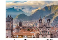
ย่านเมืองเก่าคุซโก้

** พักที่ San Agustin La Recoleta Hotel 4* หรือเทียบเท่า **