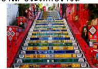
บันไดลาปา

** พักที่ Arena Copacabana Hotel 4* หรือเทียบเท่า **