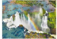
อุทยานแห่งชาติอิกวาซู

DAY4 อุทยานแห่งชาติอิกวาซู ผังบราซิล xx.xx น. ออกเดินทางสู่อุทยานแห่งชาติอิกวาซู เที่ยวบิน... xx.xx น. เดินทางถึงอุทยานแห่งชาติอิกวาซู