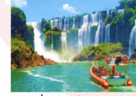
นั่งเรือเจ็ทมาคูกู ชมความสวยงามน้ำตกอิกวาซู

** พักที่ Viale Cataratas Hotel 4* หรือเทียบเท่า **