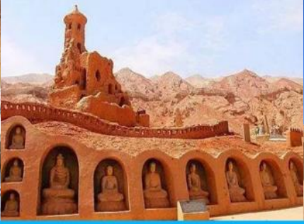
ถ้ำพระพันองค์