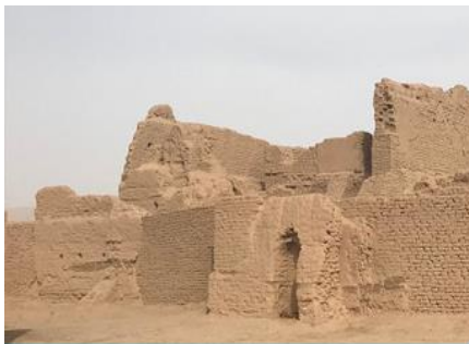
เมืองโบราณเกาซาง