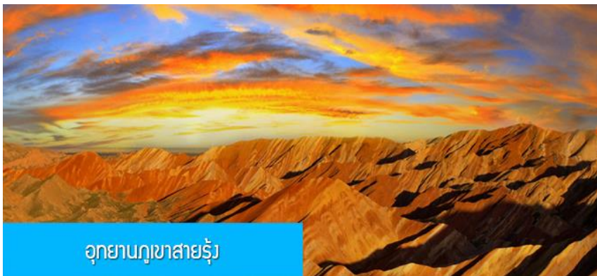
อุทยานภูเขาสายรุ้ง

พักที่ โรงแรม QIANXI SILU HOTEL ระดับ 4 ดาวท้องถิ่นหรือเทียบเท่าในเมืองจางเยี่ย