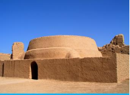
เมืองโบราณเกาซางกูเจิง