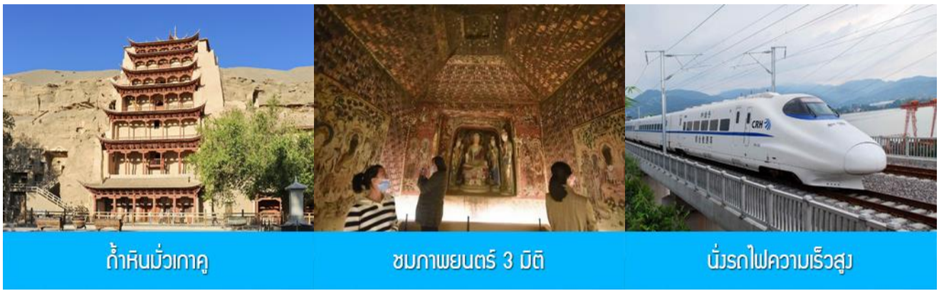
ถ้ำหินมั่วเกาคุ

พักที่ METRO PARK HOTEL โรงแรมระดับ 4 ดาวหรือเทียบเท่าในเมืองคุนหวง