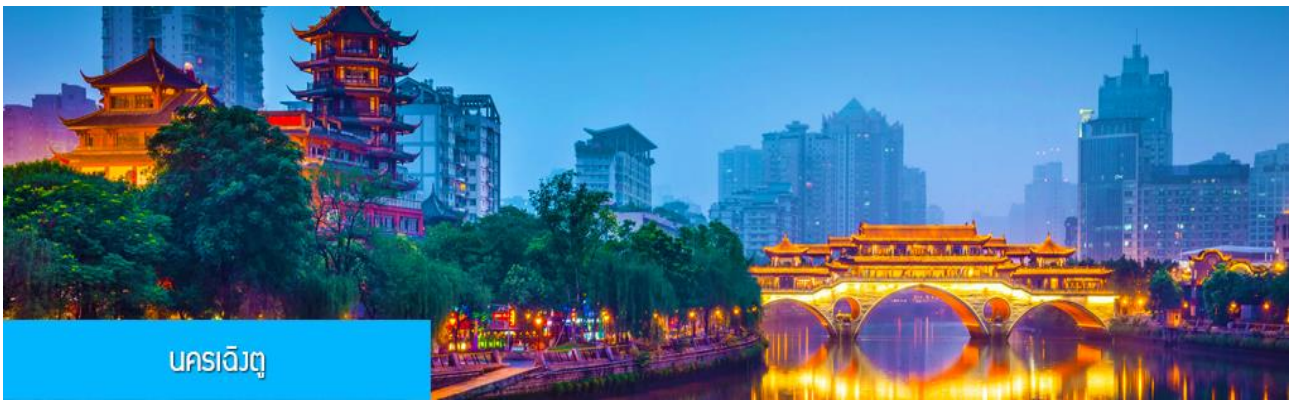
นครเฉิงตู