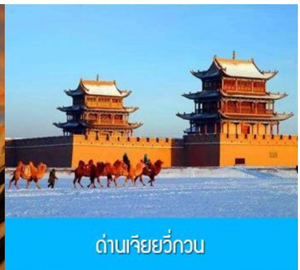
ด่านเจียวกวน