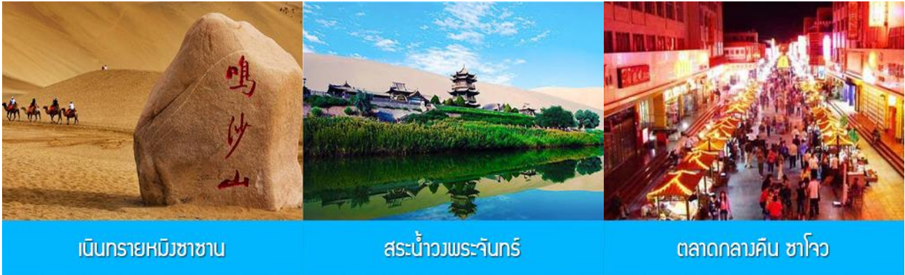
เนินทรายหมีงาช้าง

พักที่ REZEN HOTEL ระดับ 4 ดาวท้องถิ่นหรือเทียบเท่าในเมือง เจียวกวน