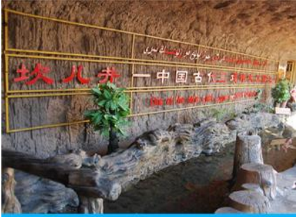
ระบบชลประทานคูหลู่ฟาน