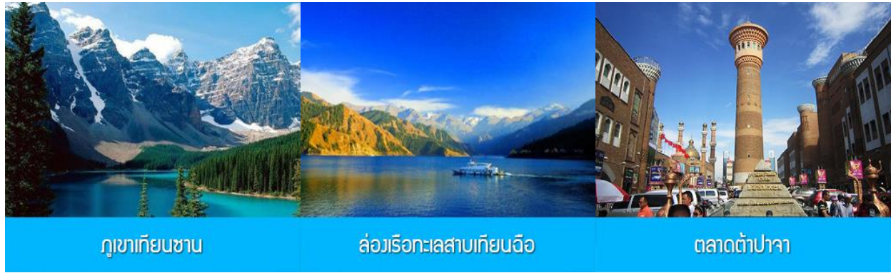
ภูเขาเทียนชาน ล่องเรือทะเลสาบเทียนฉือ ตลาดต้าปาจา

พักที่ HAMPTON BY HILTON URUMQI HOTEL โรงแรมระดับ 4 ดาวหรือเทียบเท่าในเมืองอูรูมฉี