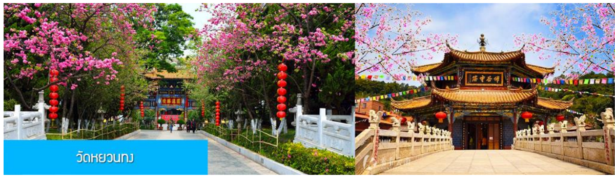
วัดห้วยนก