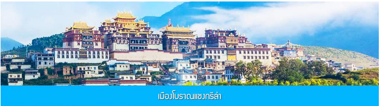
เมืองโบราณเซวกรี่ล่า