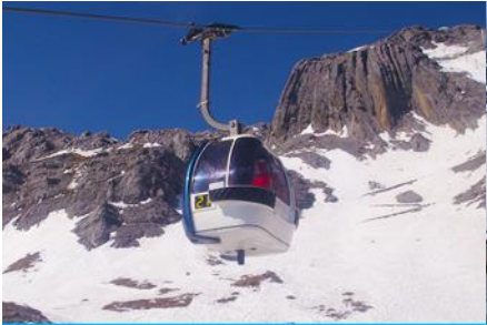
ภูเขาหิมะมังกรหยก (บันไดกระเช้าใหญ่)

ที่พัก FENG HUANG HOTEL ระดับ 4 ดาว หรือเทียบเท่าเมืองลี่เจียง