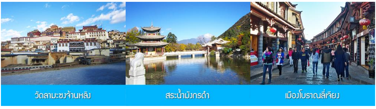
วัดลามาซวงจ้านหลิง