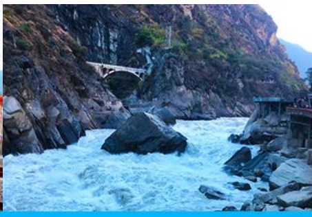
ช่องแคบเลือกระโจน