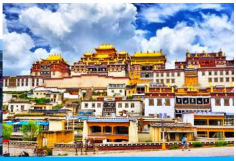
เมืองแซงการีล่า

วันที่สอง เมืองคุนหมิง-นั่งรถไฟความเร็วสูงสู่เมืองต้าหลี่-ช่องแคบเลือกระโจน-จงเตี้ยน-เมืองโบราณแซงการีล่า