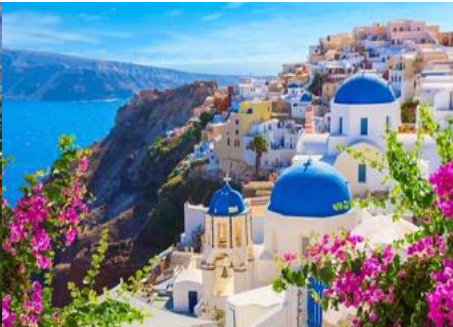
ย่านซานโตรินี่