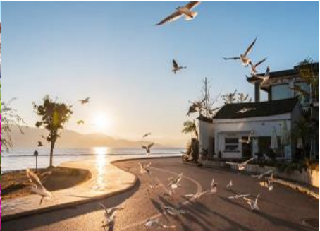
ย่านชายหาดรูป S