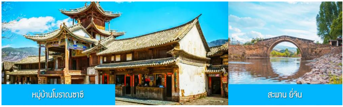
หมู่บ้านโบราณซาซี