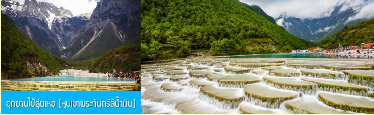
อุทยานไป๋ส่วยเหอ (หุบเขาพระจันทร์สีน้ำเงิน)

-รวมค่ากระเช้าขึ้น ลง ณ สถานีกระเช้า หยุนซานผิงที่สามารถเห็นภูเขาหิมะและทุ่งหญ้าสวิส (อยู่เหนือระดับน้ำทะเล 3,240 เมตร) จุดชมวิว หยุนซานผิง 云杉坪 เป็นทุ่งหญ้าขนาดใหญ่ ด้านทิศตะวันออกของยอดเขาหิมะมังกรหยก ณ จุดนี้นอกจากจะสามารถมองเห็นทัศนียภาพของภูเขาหิมะยังเป็นทุ่งหญ้าสีเขียวที่เสมือนพรมผืนมหึมาที่ปูอยู่บริเวณไหล่เขาของภูเขาหิมะมังกรหยก ได้รับการขนานนามว่าเป็นสวิสแห่งมณฑลยูนนาน