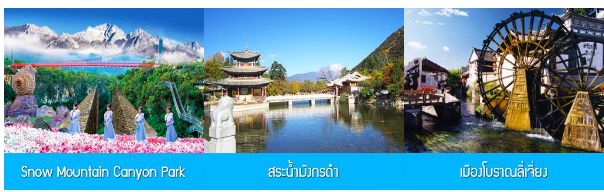
Snow Mountain Canyon Park

พักที่ LIJIANG FENGHUANG HOTEL โรงแรมระดับ 4 ดาวท้องถิ่น หรือเทียบเท่าในเมืองลี่เจียง