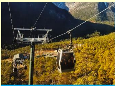
บึงกระเช้าสถานี หยุนชานผิง

หรือท่านสามารถเลือกซื้อโปรแกรมเสริม OPTIONAL TOUR แพคเกจท่องเที่ยวภูเขาหิมะมังกรหยกแบบครึ่งวัน อัตราค่าบริการท่านละ 3,500 บาท ในอัตราค่าบริการรวมรายการดังนี้