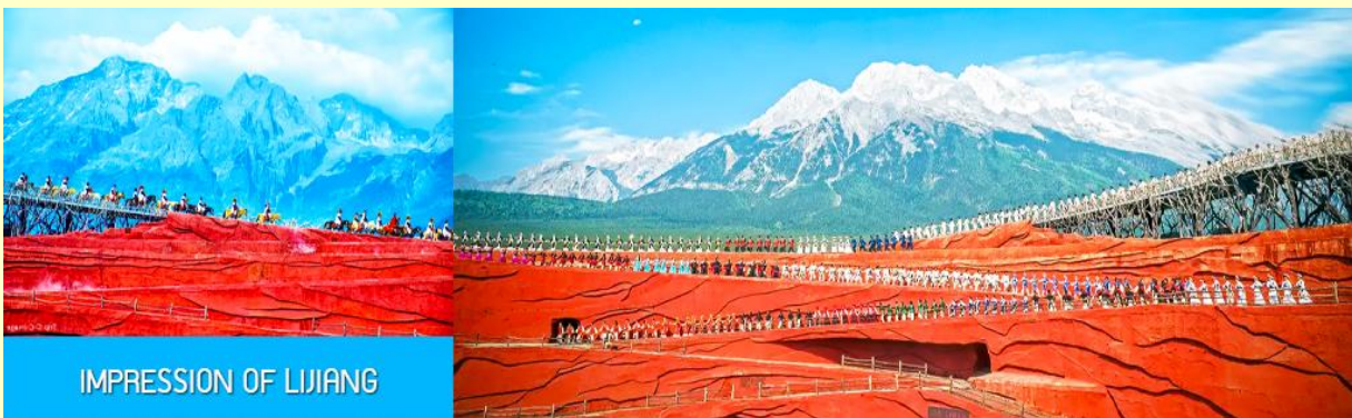
IMPRESSION OF LIJIANG