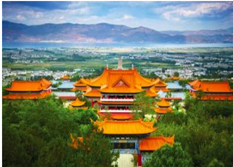
เมืองต้าหลี่