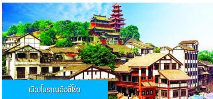
เมืองโบราณฉือชิว

OPTIONAL TOUR ไกด์นำสนอโปรแกรมล่องเรือ ชมความสวยงามสองริมฝั่งแม่น้ำของมหานครจงชิ่ง ท่านละ 280 หยวน หรือ 1,400 บาท