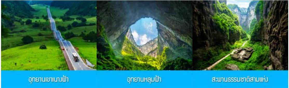
อุทยานเขาเนงฟ้า

พักที่ MOUNTAIN VIEW HTL // DAWEIYING HTL โรงแรมระดับ 4 ดาวหรือเทียบเท่าในเมืองอู่หลง