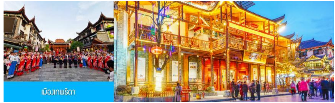
เมืองเทพธิดา