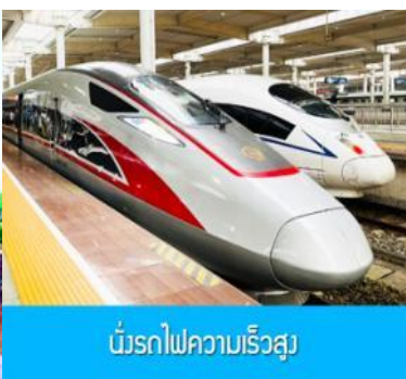
บริการไฟความเร็วสูง

วันที่หก นครจงชิ่ง-เมืองโบราณฉือชิว-รถไฟความเร็วสูงสู่เมืองหยีซาง-อิสระช้อปปิ้งย่านการค้า