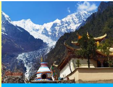
ธารน้ำแข็ง หมิวหย่ง