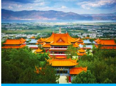
เมืองต้าหลี่