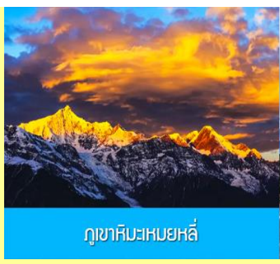
ภูเขาหิมะเหมยหลี่

หลังอาหารนำท่านเข้าสู่โรงแรมที่พักในเมืองเต๋อซิ่น ให้ท่านพักผ่อนหรือเดินเล่นถ่ายภาพในเมืองตามอัธยาศัย