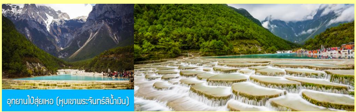
อุทยานไป๋ส่วยเหอ (หุบเขาพระจันทร์สีน้ำเงิน)