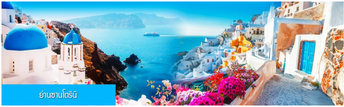
ย่านซานโตรินี่