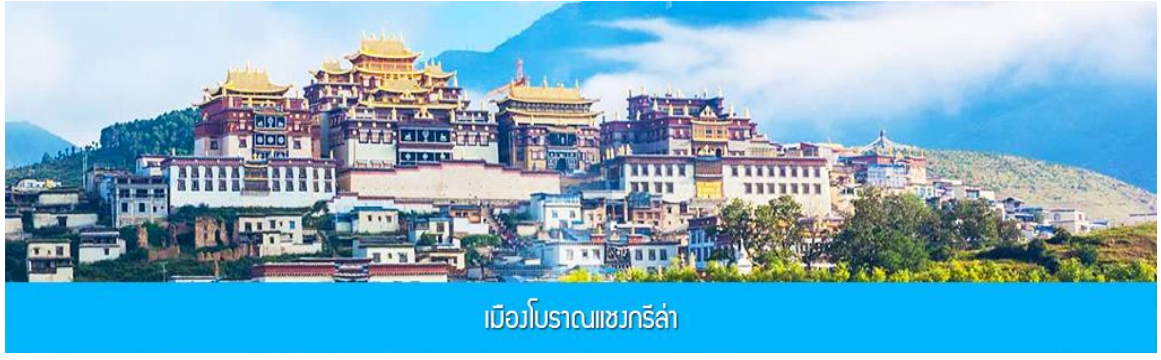
เมืองโบราณแซงกรีล่า