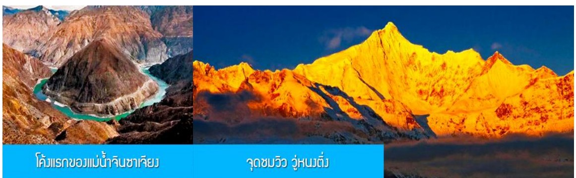
โค้งแรกของแม่น้ำจินซาเจียง

พักที่ PHOENIX HOTEL โรงแรมระดับ 4 ดาวท้องถิ่น หรือเทียบเท่าในเมืองแซงกรีล่า