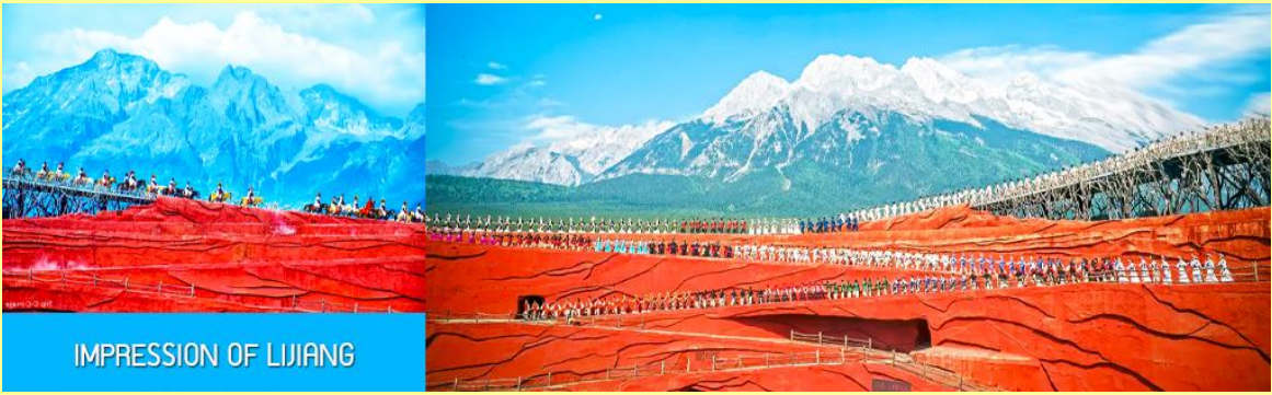
IMPRESSION OF LIJIANG