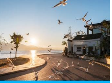
ย่านชายหาดรูป S