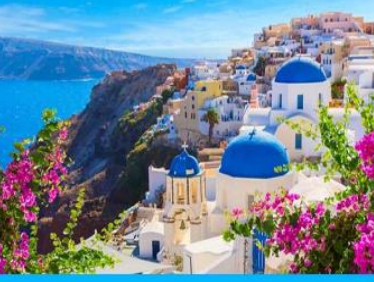
ย่านซานโตรินี่