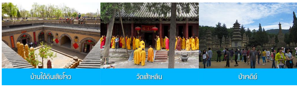
บ้านใต้ดินเสียโจว วัดเส้าหลิน ป่าเจดีย์

พักที่ VIENNA INTER HOTEL 4* หรือ โรงแรมในระดับเดียวกัน เมืองซานเหมินเสีย