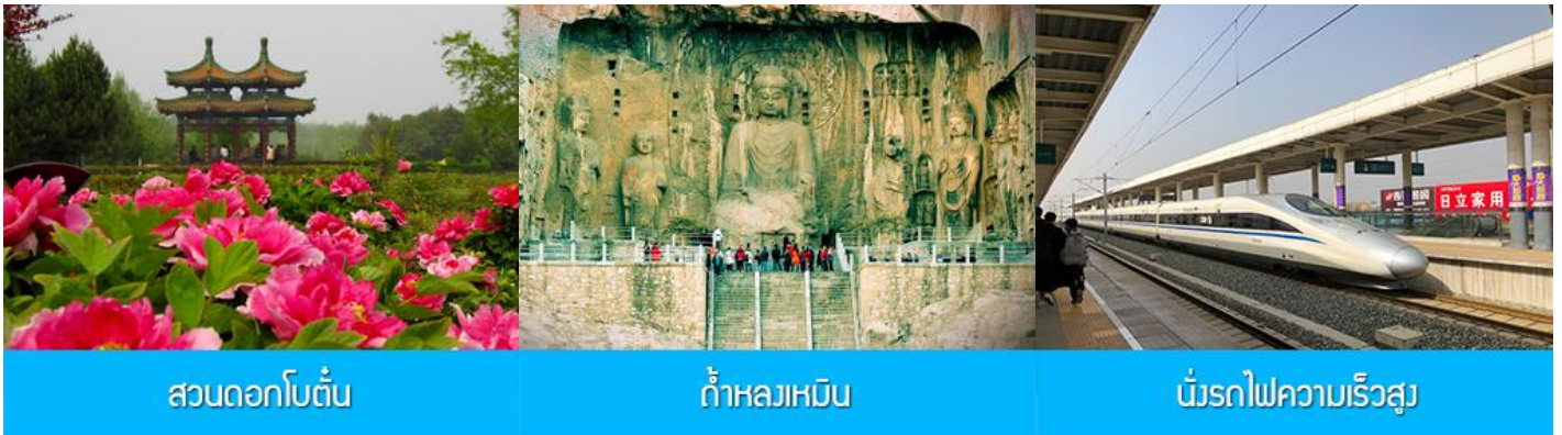
สวนดอกโบตั๋น