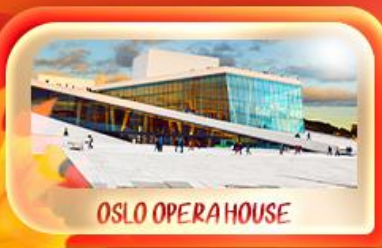
OSLO OPERA HOUSE