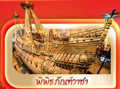
พิพิธภัณฑ์เว้าชา